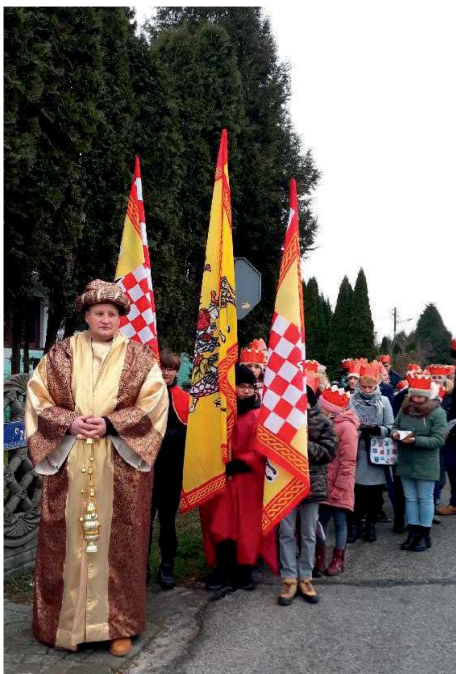
Orszak Trzech Króli