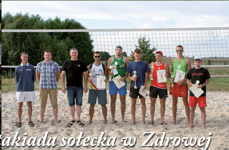
III spartakiada sotecka w Zdrowej