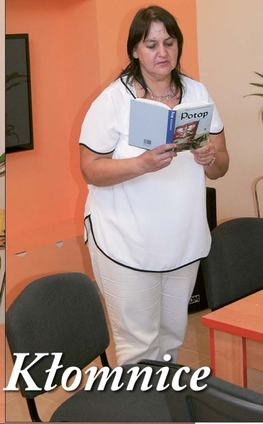
„Narodowe Czytanie” w Gminie Kłomnice