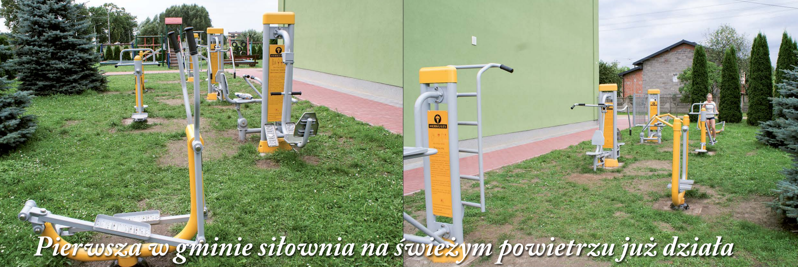
Pierwsza w gminie siłownia na świeżym powietrzu już działa