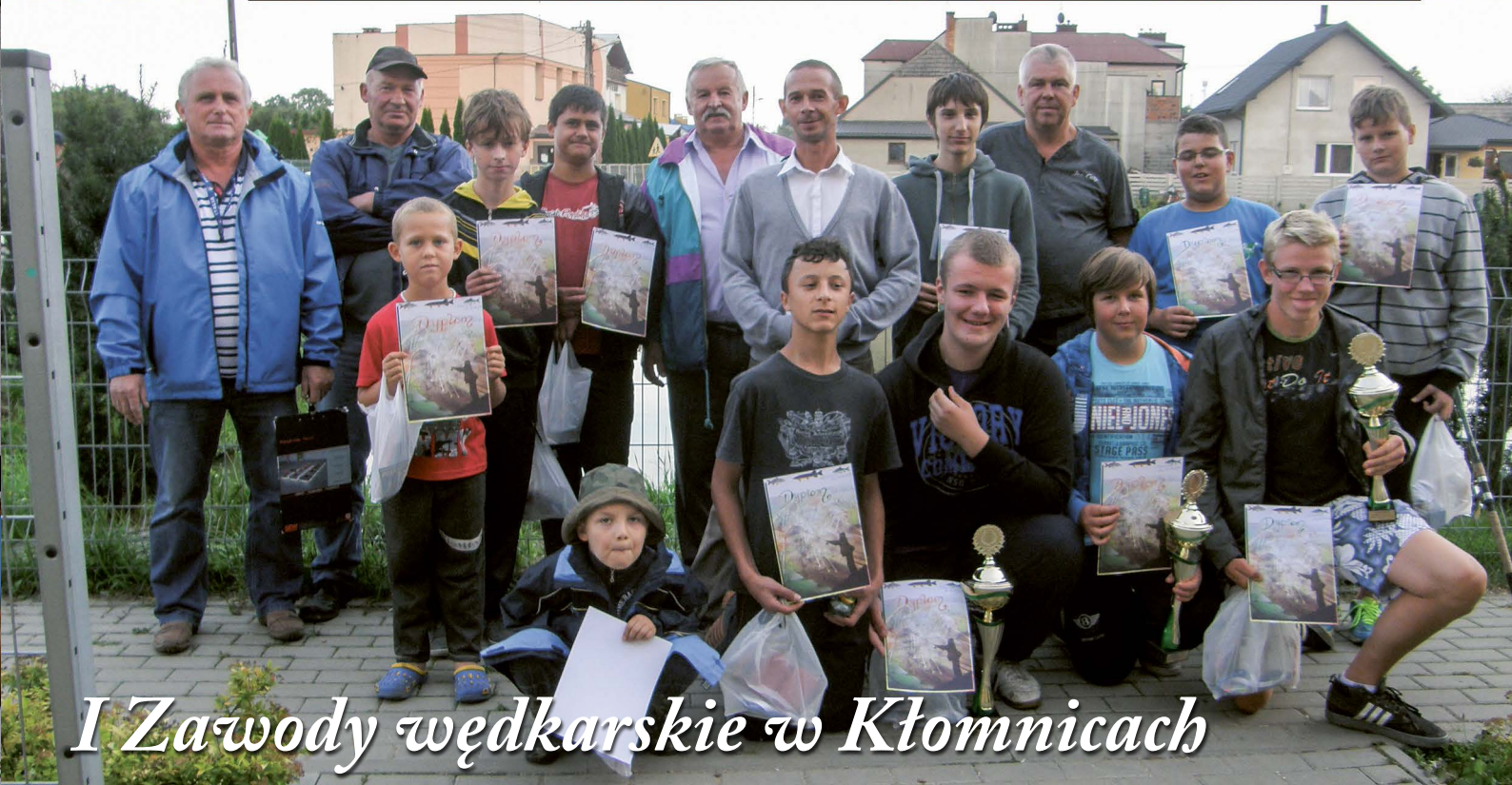
I Zawody wędkarskie w Kłomnicach