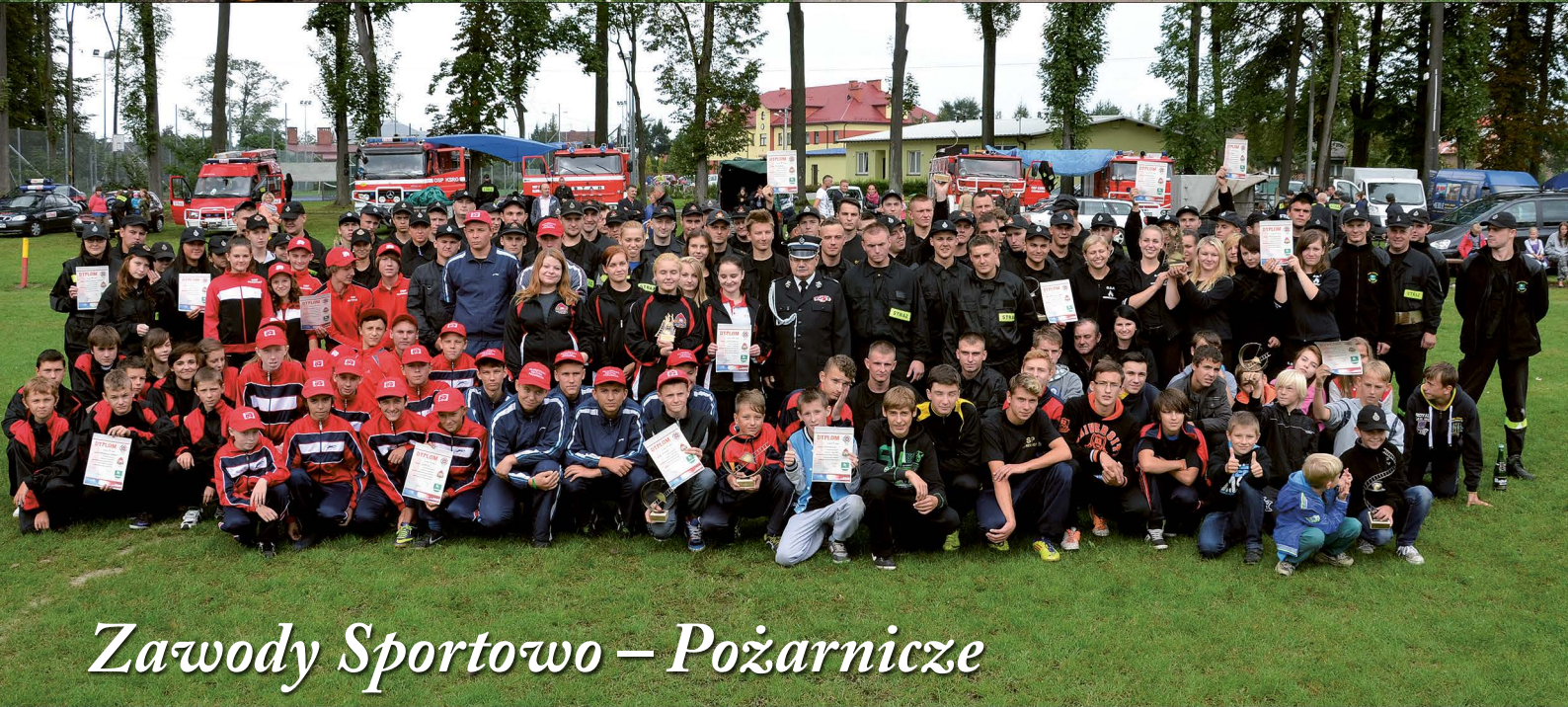
Zawody Sportowo – Pożarnicze