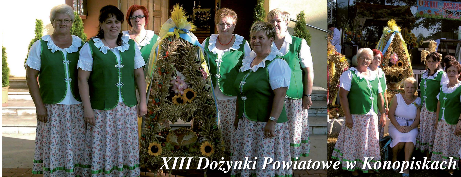
XIII Dożynki Powiatowe w Konopiskach