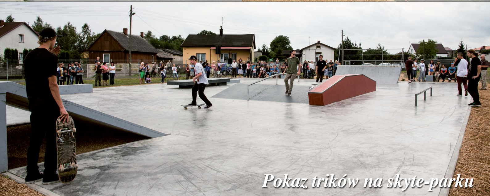
Pokaz trików na skyte-parku