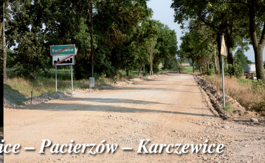
Roboty przy przebudowie drogi powiatowej na odcinku Kłomnice – Pacierzów – Karczewice