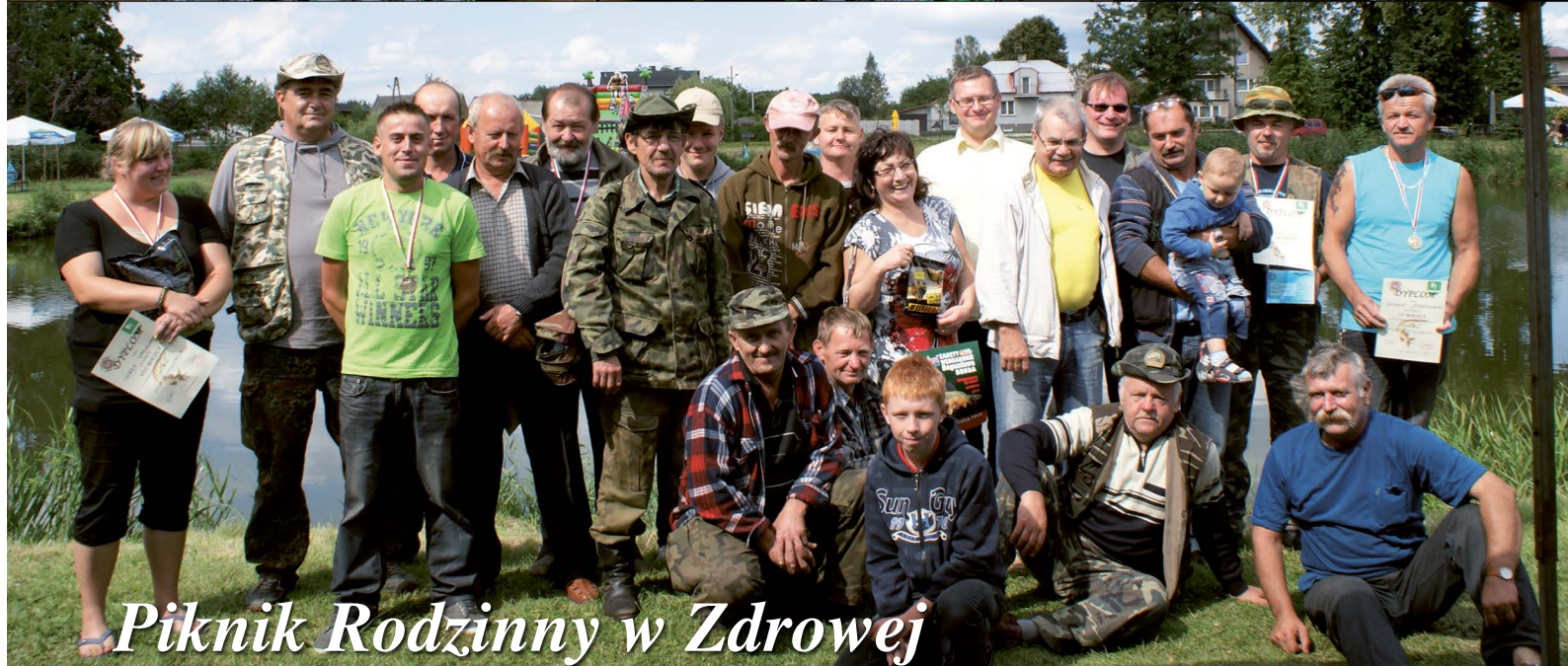
Piknik Rodzinny w Zdrowej