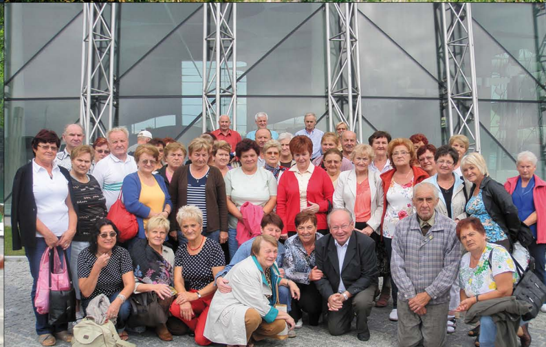
Emerycy w Kleszczowie i w Ostrowach