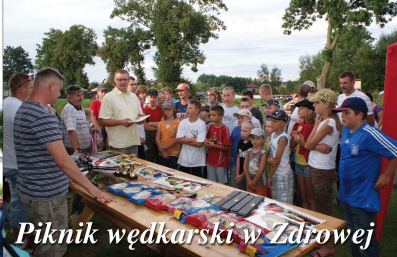
Piknik wędkarski w Zdrowej