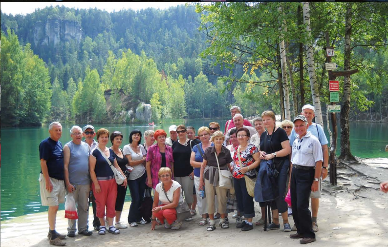
Wypoczynek w Sudetach