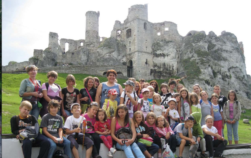
Akcja „Wakacje” w GOK