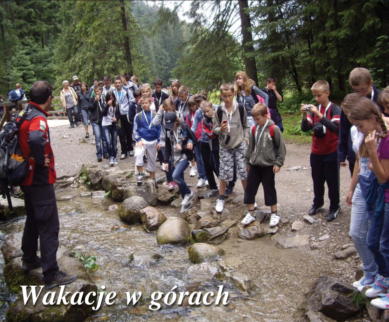
Wakacje w górach