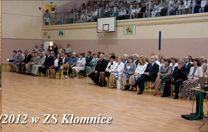
Inauguracja Roku szkolnego 2011/2012 w ZS Kłomnice