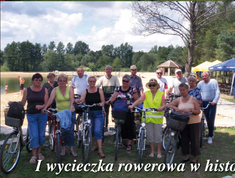
I wycieczka rowerowa w historii...