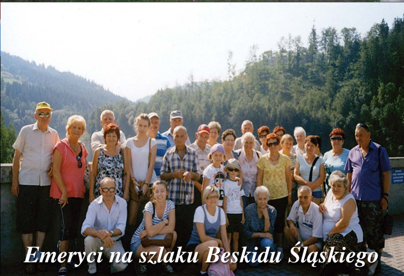
Emerycy na szlaku Beskidu Śląskiego