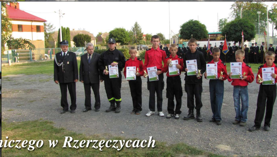
Poświęcenie samochodu pożarniczego w Rzerzeczycach