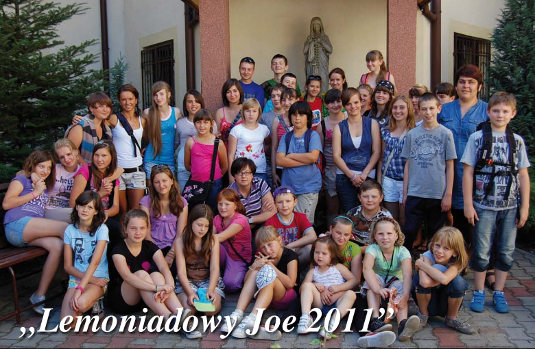
„Lemoniadowy Joe 2011”