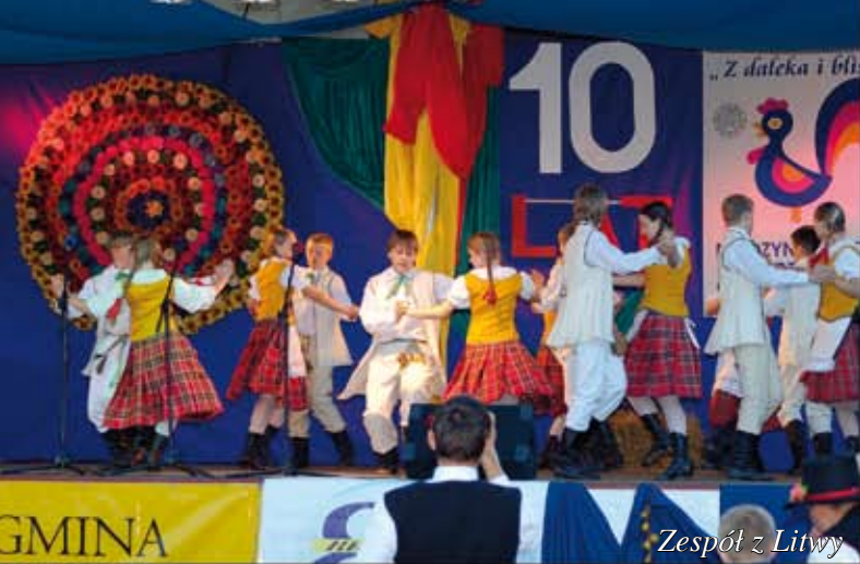
Zespół z Litwy