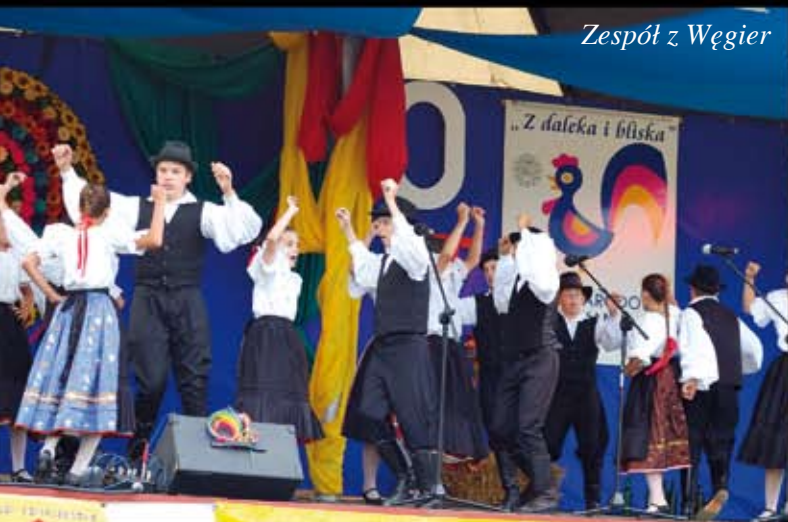
Zespół z Węgier