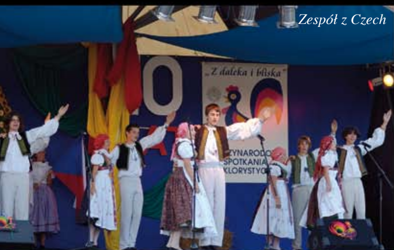
Zespół z Czech