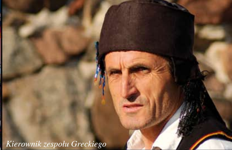
Kierownik zespołu Greckiego