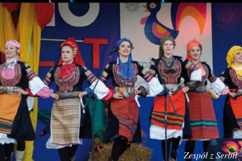
Zespół z Serbii