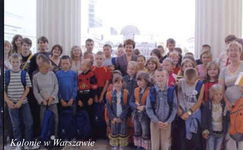
Kolonie w Warszawie