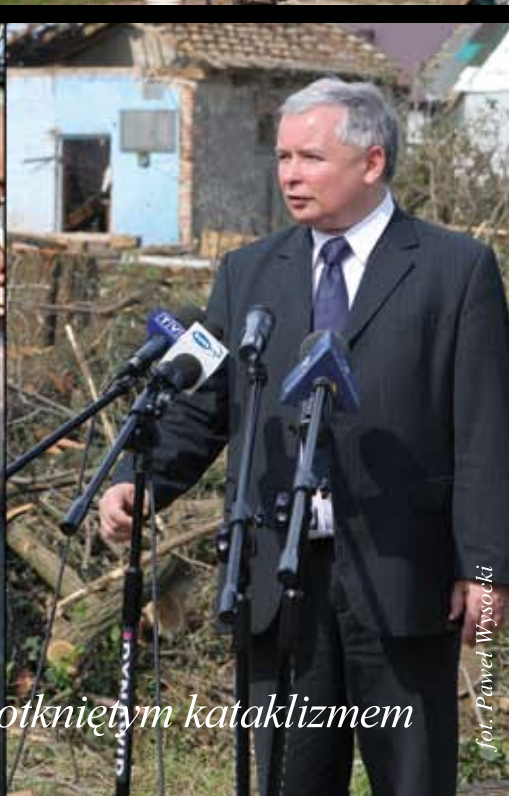
Wizyta premiera Jarosława Kaczyńskiego na terenie dotkniętym kataklizmem