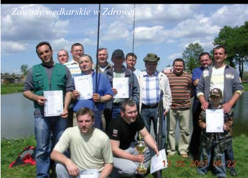
Zawody wędkarskie w Zdrowej