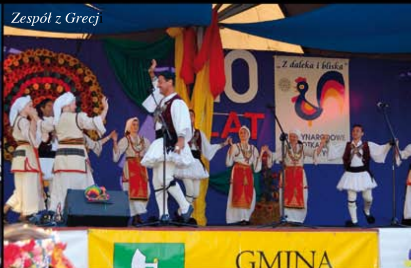
Zespół z Grecji