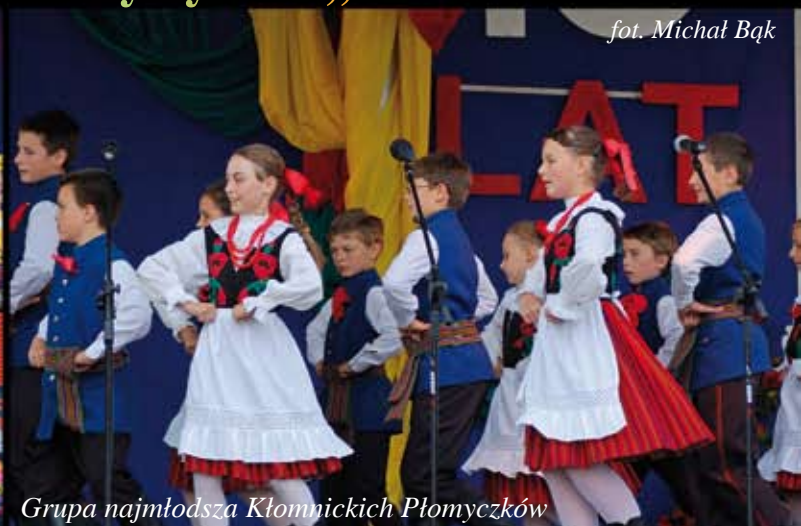
Grupa najmłodsza Kłomnickich Płomyczków