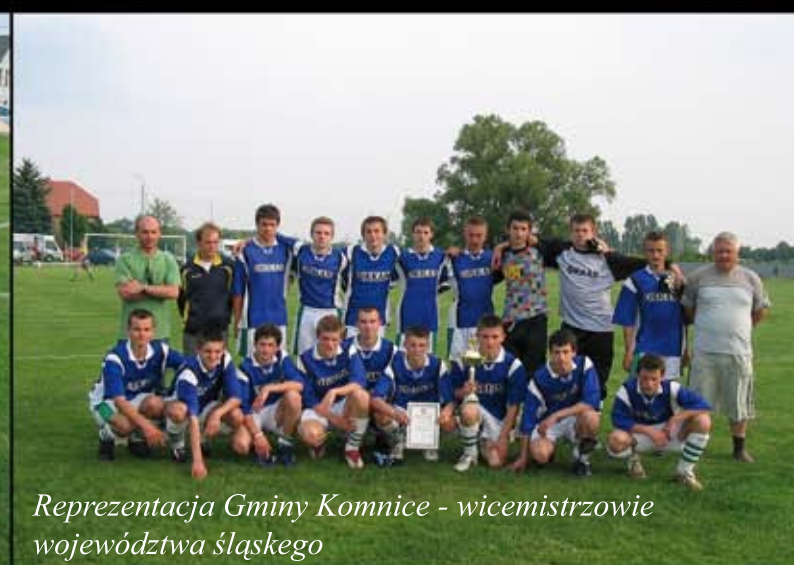
Reprezentacja Gminy Komnice - wicemistrzowie województwa śląskiego