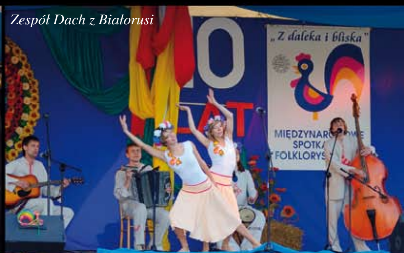
Zespół Dach z Białorusi