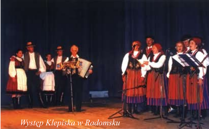
Występ Klepiska w Radomsku