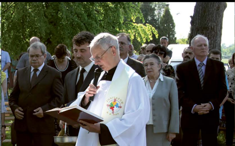
Odświeżenie i poświęcenie nowej płyty pamiątkowej w Parku im. Braci Reszke w Garnku