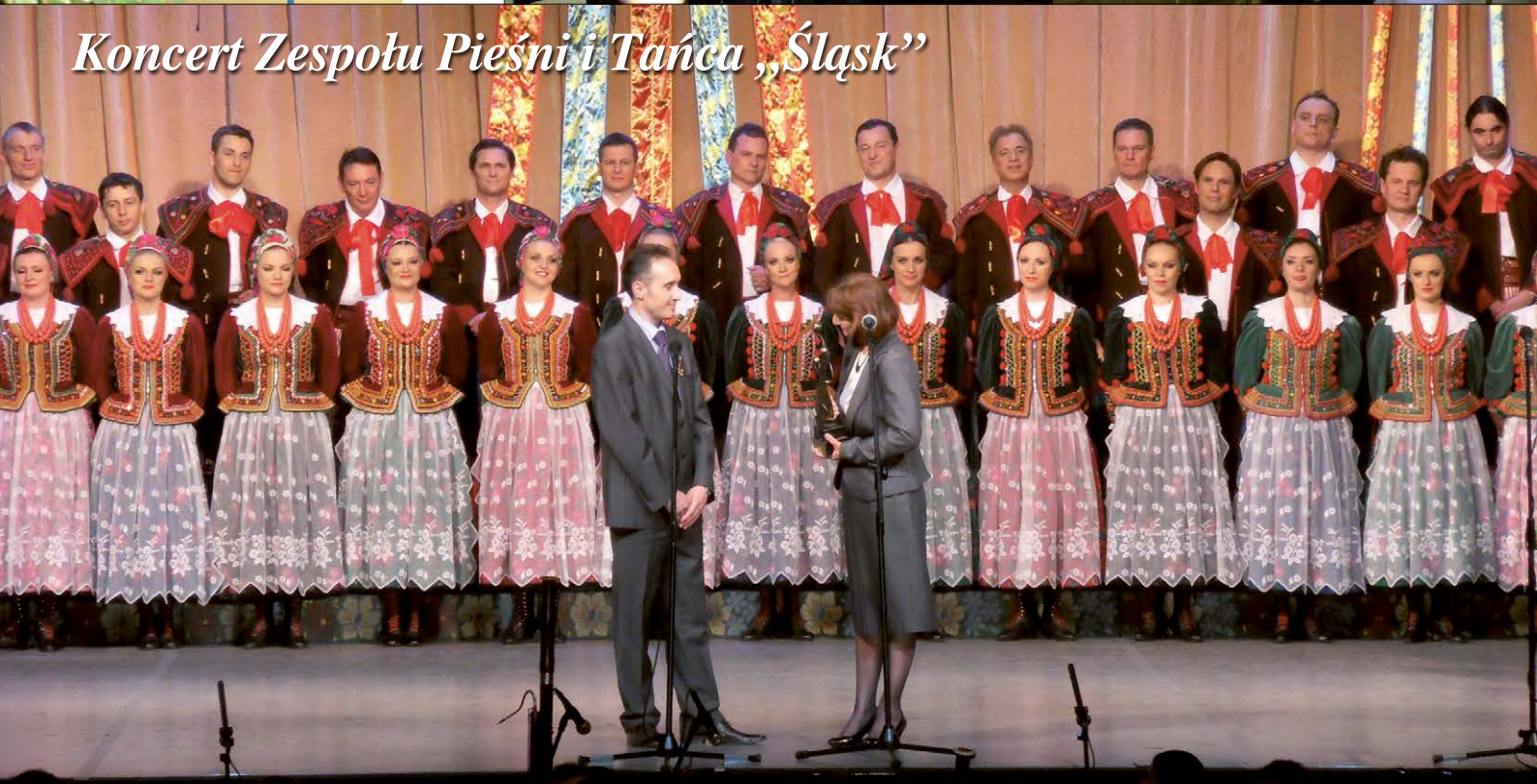
Koncert Zespołu Pieśni i Tańca „Śląsk”