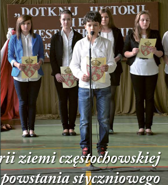
Dotknij historii ziemi częstochowskiej 150-ta rocznica powstania styczniowego