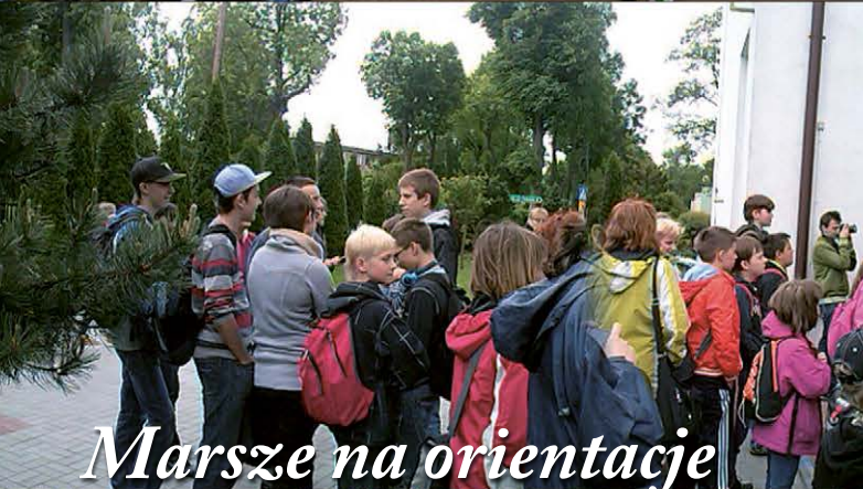
Marsze na orientacje