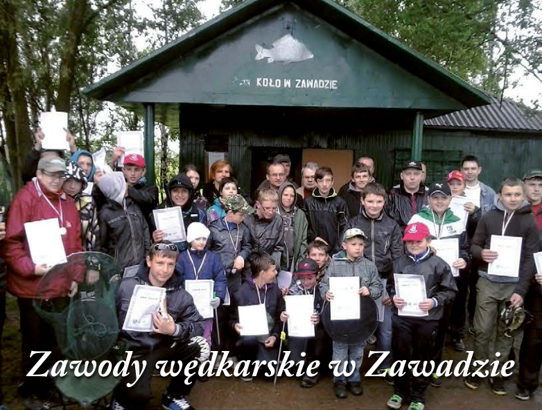
Zawody wędkarskie w Zawadzie