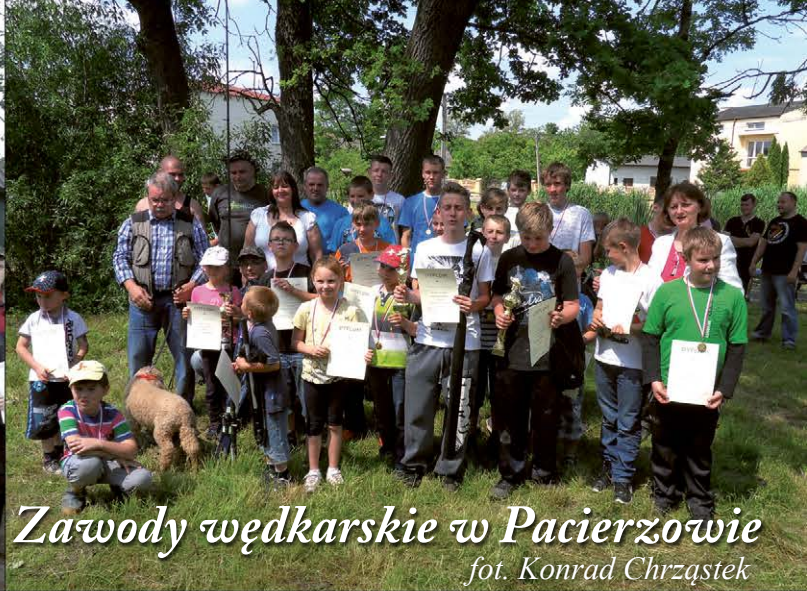
Zawody wędkarskie w Pacierzowie