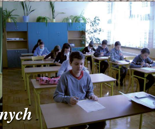
Powiatowe konkursy wiedzy o lekturach szkolnych