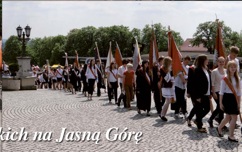
Pielgrzymka szkół prymasowskich na Jasną Górę