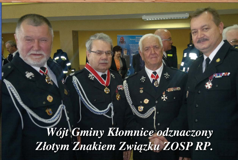
Wójt Gminy Kłomnice odznaczony Złotym Znakiem Związku ZOSP RP.