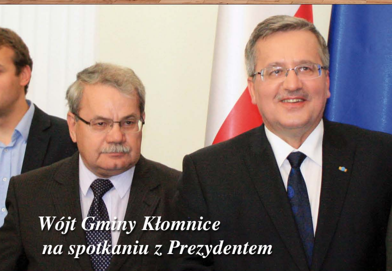
Wójt Gminy Kłomnice na spotkaniu z Prezydentem