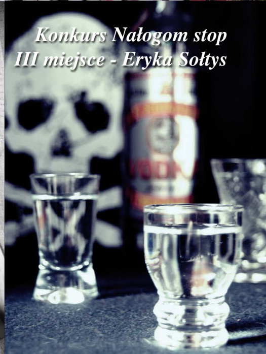
Konkurs Nałogom stop III miejsce - Eryka Soltys