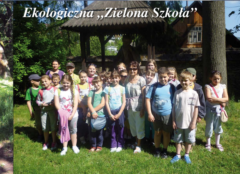
Ekologiczna „Zielona Szkoła”