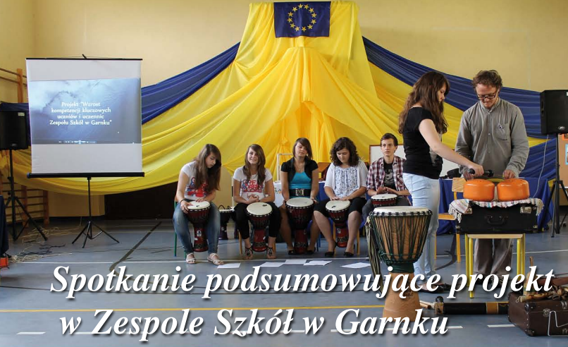
Spotkanie podsumowujące projekt w Zespole Szkół w Garnku