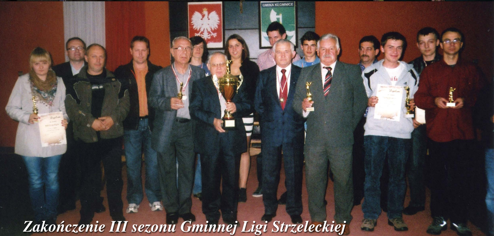
Zakończenie III sezonu Gminnej Ligi Strzeleckiej