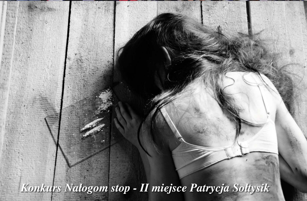
Konkurs Nałogom stop - II miejsce Patrycja Soltysik