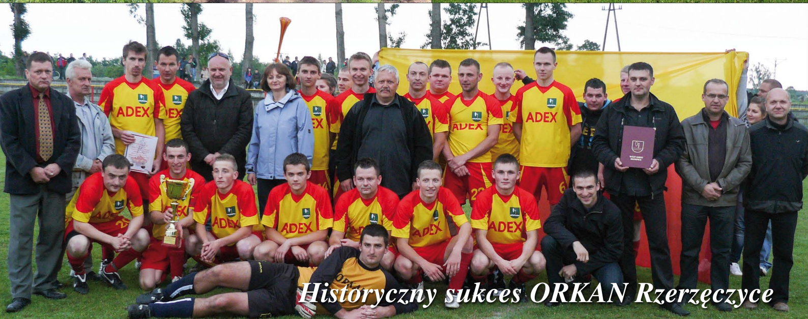
Historyczny sukces ORKAN Rzerzeczyce