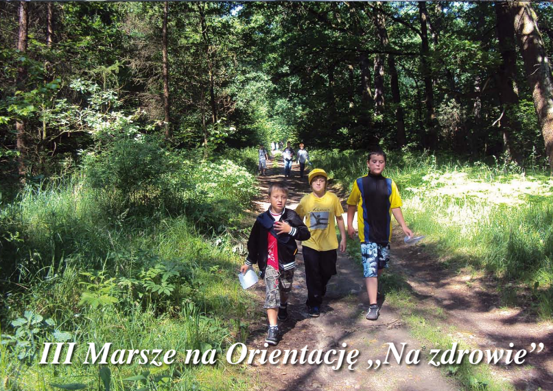
III Marsze na Orientację „Na zdrowie”