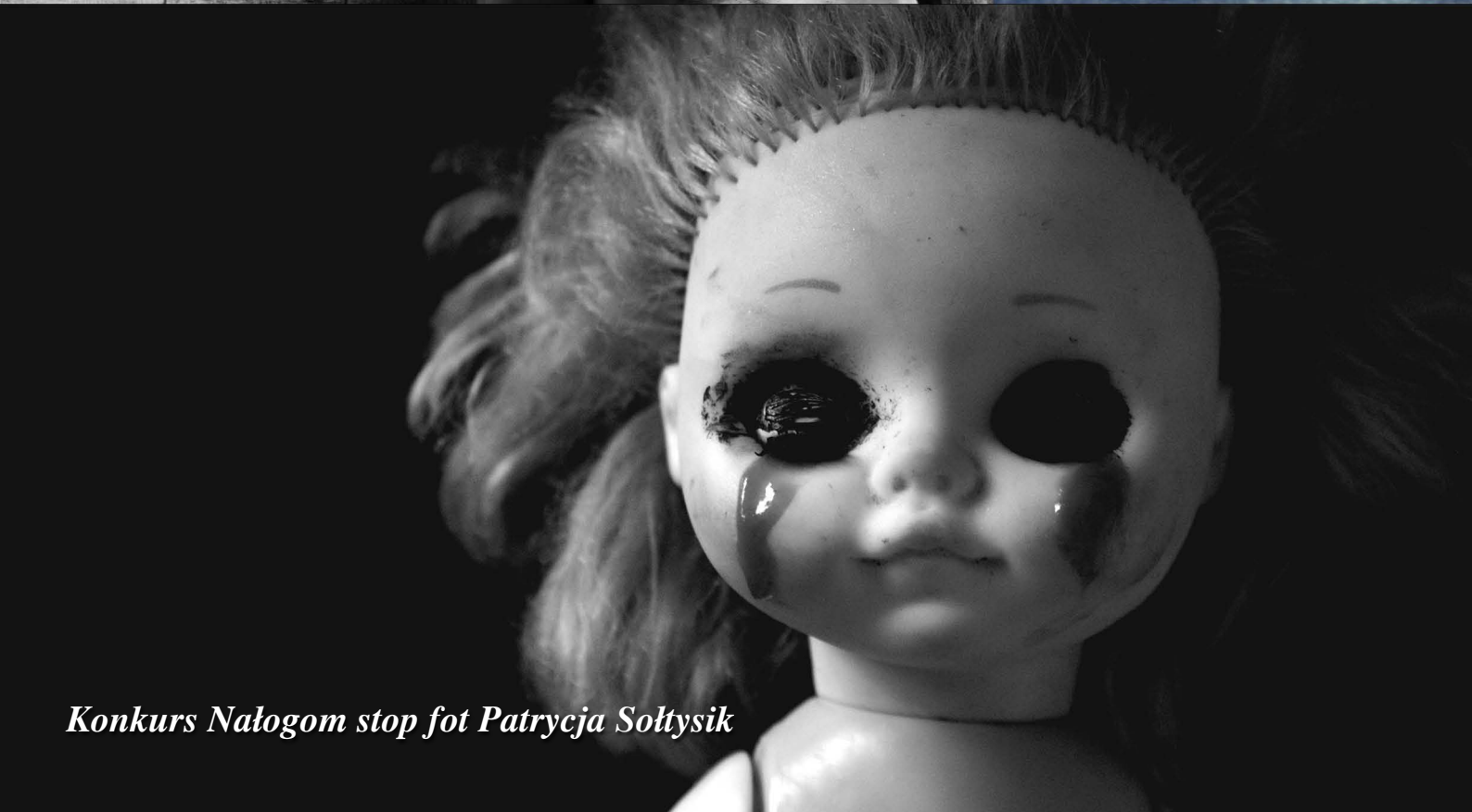
Konkurs Nałogom stop