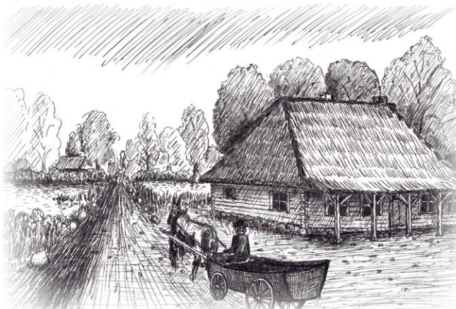
Karczma i droga do dworu, rys. Krzysztof Wójcik

Za szeregiem stawów na południe od plebani znajdował się kłomnicki dwór, tak mniej