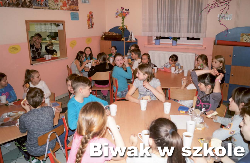
Biwak w szkole