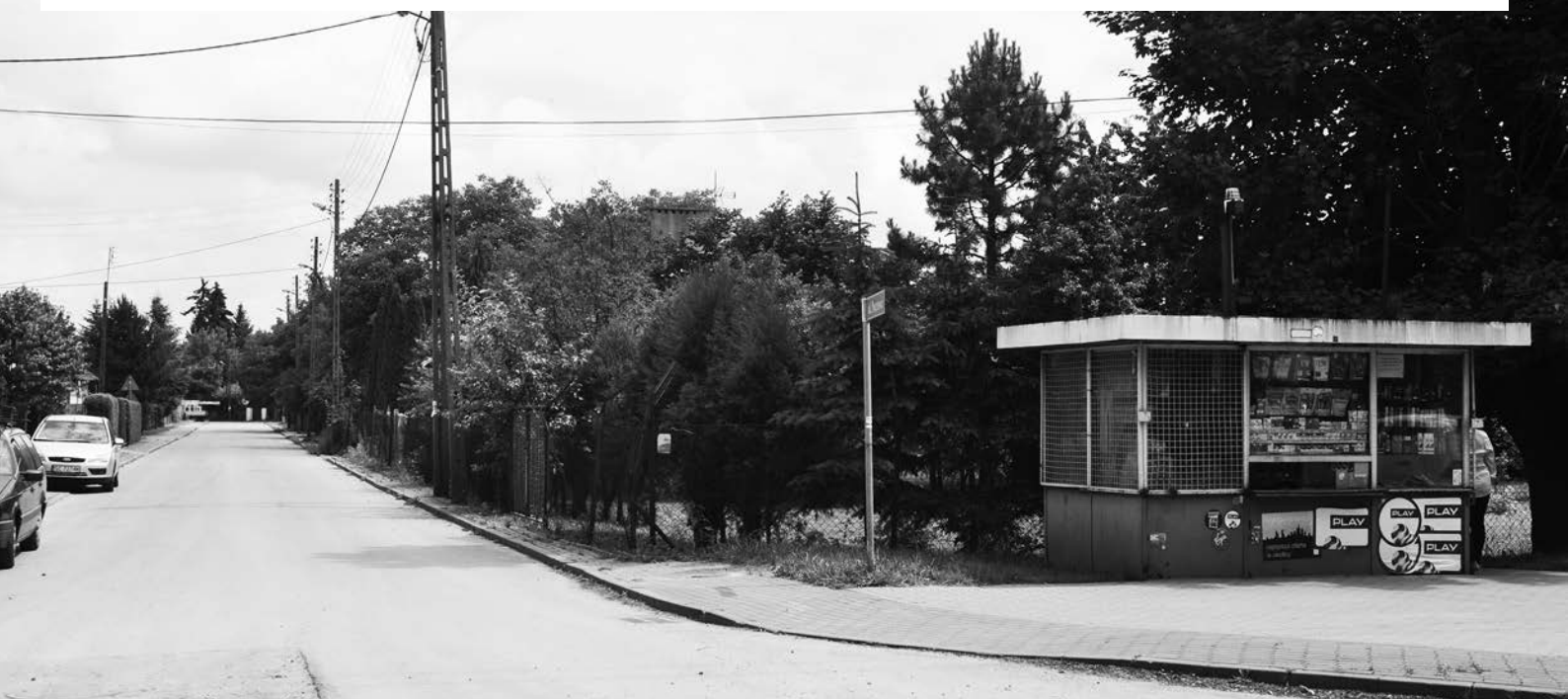
Wylot ulicy Pocztowej na ulice Dworcową

Na koniec dziękuję wszystkim czytelnikom za słowa uznania, za informacje i dzielenie się swoimi zbiorami oraz zachęcam do kontaktu na adres krzysztofwojcik15@gmail.com . Poszukuję od dawna zdjęć niektórych obiektów w Klomnicach i okolicy, np. starego dworu w Klomnicach, dworu w Lipiczu, itp. Z góry dziękuję i jednocześnie zachęcam do poszukiwań!«