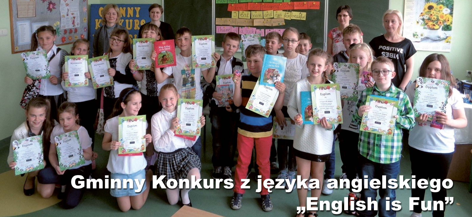
Gminny Konkurs z języka angielskiego „English is Fun”