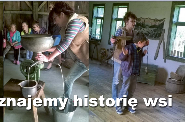
Poznajemy historię wsi