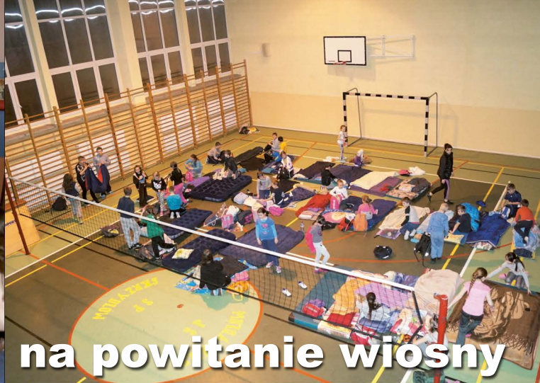
na powitanie wiosny