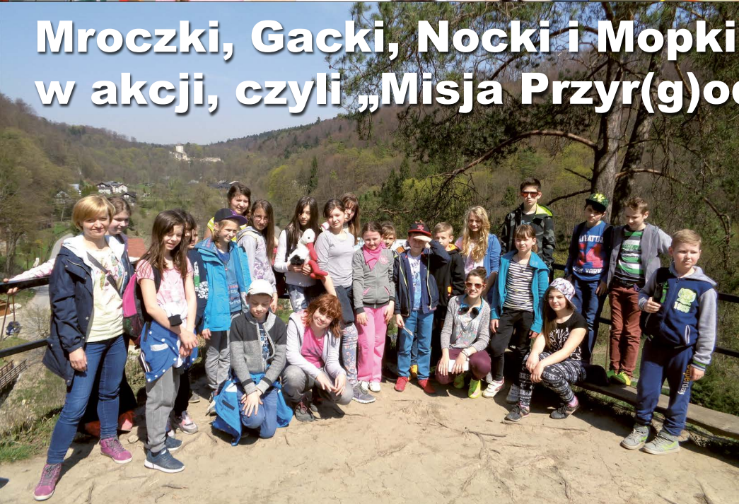
Mroczki, Gacki, Nocki i Mopki w akcji, czyli „Misja Przyr(g)oda”