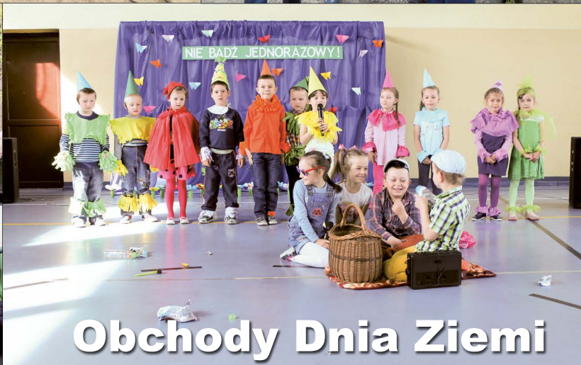
Obchody Dnia Ziemi