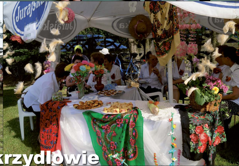
Niedziela – tylko w Skrzydlowie