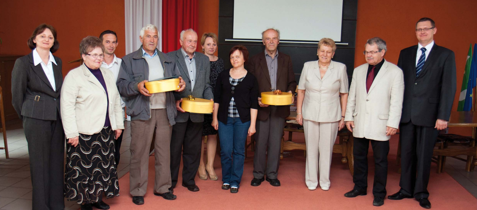
Ustępujący Sołtysi kadencji 2007-2011 wraz z władzami Gminy i pracownikami urzędu