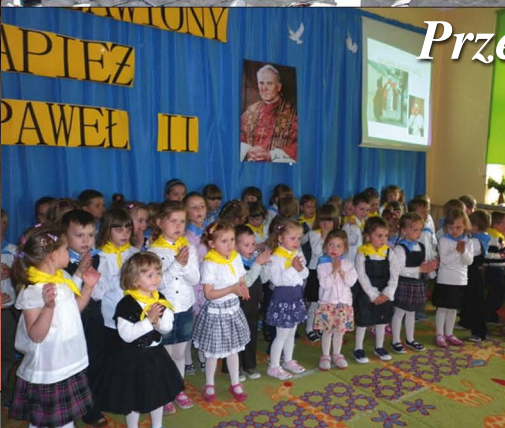
Przedszkolaki uczcili beatyfikację Jana Pawła II