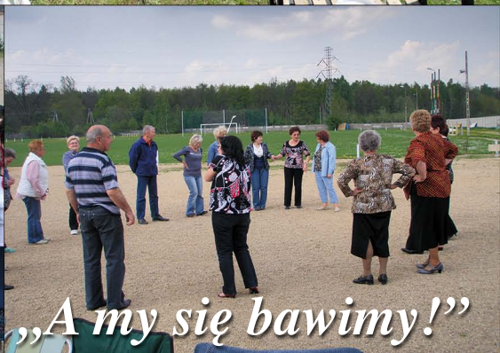
„A my się bawimy!”