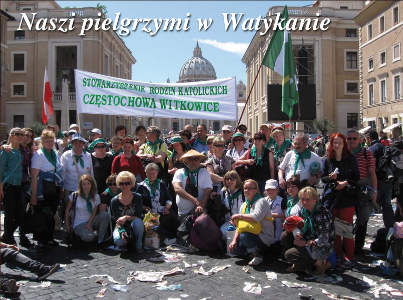
Naszi pielgrzymi w Watykanie