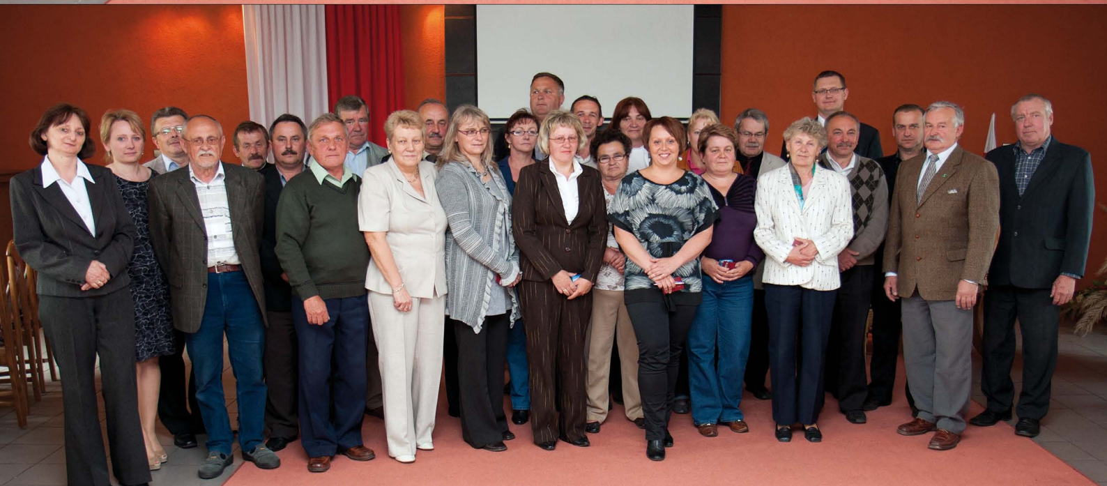
Nowo wybrani Sołtysi kadencji 2011-2015 wraz z władzami Gminy i pracownikami urzędu