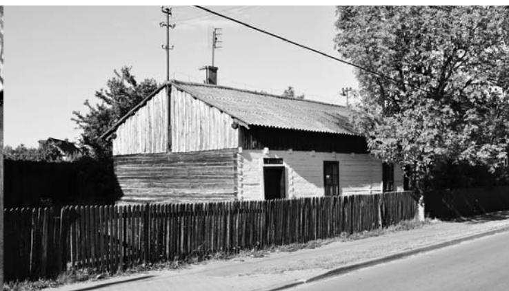
Chata o konstrukcji zrębowej w Kłomnicach. Obok ta sama chata około 100 lat wcześniej na fotografii przedstawiającej obecną ulicę Bartkowiacką

się tu różne sklepy. Podobny budynek stał jeszcze przed kilku laty niedaleko koło plebanii, gdzie obecnie jest zespół sklepów. Został rozebrany, gdyż groził zawaleniem. Ten jednak jest jednak w dobrym stanie i po remoncie może jeszcze długie lata służyć właścicielom.