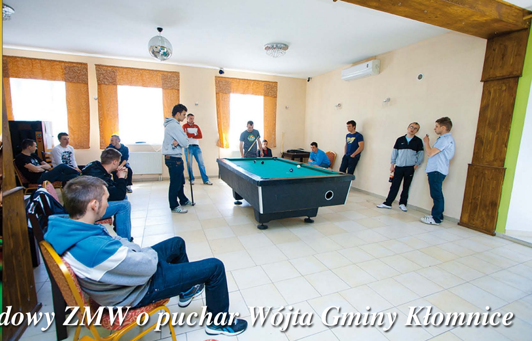
IV Turniej Bilardowy ZMW o puchar Wójta Gminy Kłomnice