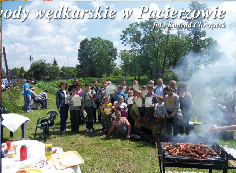
Zawody wędkarskie w Pacierzowie