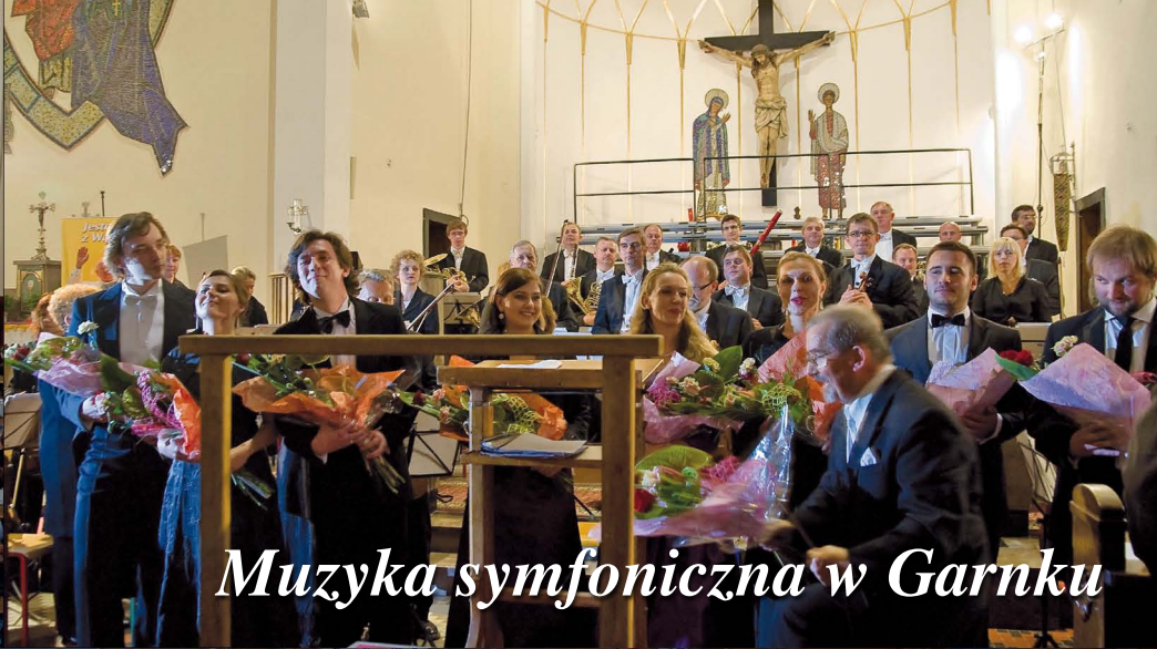
Muzyka symfoniczna w Garnku