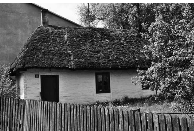
Chata w karczewicach

Dom naprzeciw kościoła na ul. Częstochowskiej zbudowano na pewno przed I wojną światową i widnieje on w ewidencji zabytków. Niedawno odebrano część desek tzw. szalunku i ukazały się potężne belki, których użyto do budowy i doskonale widać na nich szczegóły świadczące o konstrukcji zrębowej. Był to nie tylko dom mieszkalny, bo w czasie jego istnienia mieściły