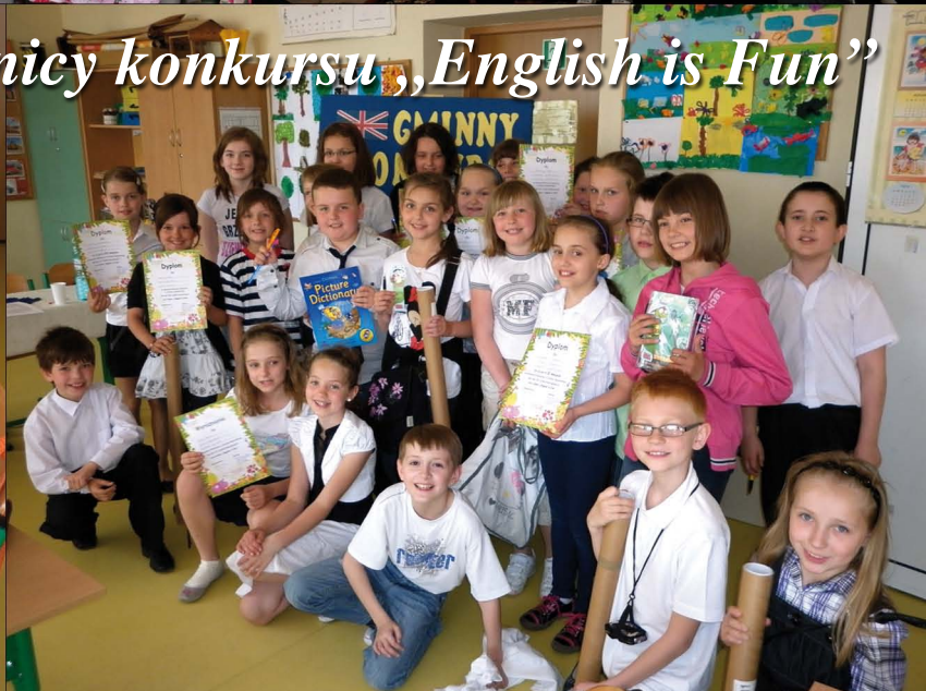
Uczestnicy konkursu „English is Fun”