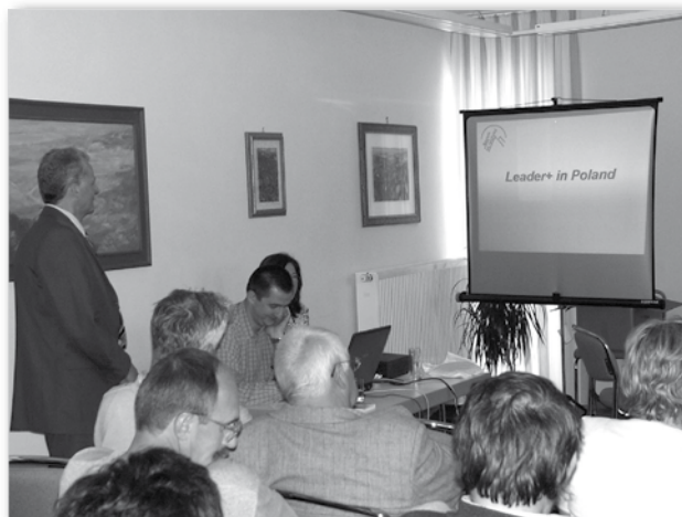
Prezentacja LGD „Razem na Wyżyny” podczas wspólnego seminarium z LAG „Południowy Steigerwald”.

Był to bardzo pouczający wyjazd, dający wiele nowych doświadczeń przedstawicielom pięciu gmin tworzących LGD „Razem na Wyżyny”. Niemcy w ciągu swojej dziesięcioletniej działalności osiągnęli bardzo interesujące efekty. Przekonaliśmy się, że w ramach programu Leader+ można realizować najbardziej śmiałe pomysły, takie które powszechnie uznawane są za szalone! Można zatem realizować marzenia. I to jest wspaniałe.