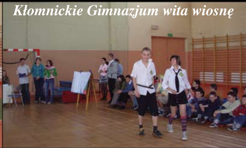
Kłomnickie Gimnazjum wita wiosnę