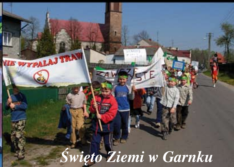
Święto Ziemi w Garnku