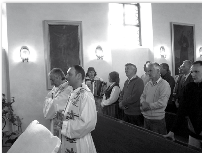
Podczas wspólnej Mszy św. w Klasztorze oo. Franciszkanów w Kloster Schwarzenberg.