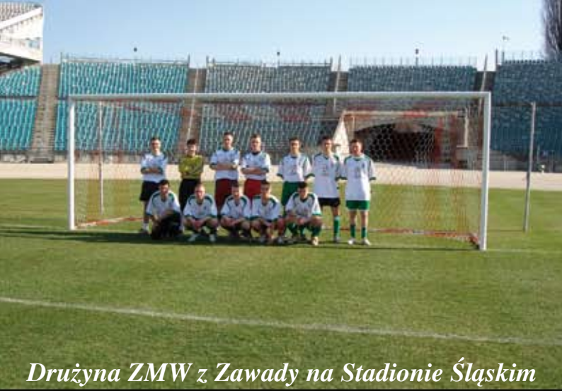
Drużyna ZMW z Zawady na Stadionie Śląskim