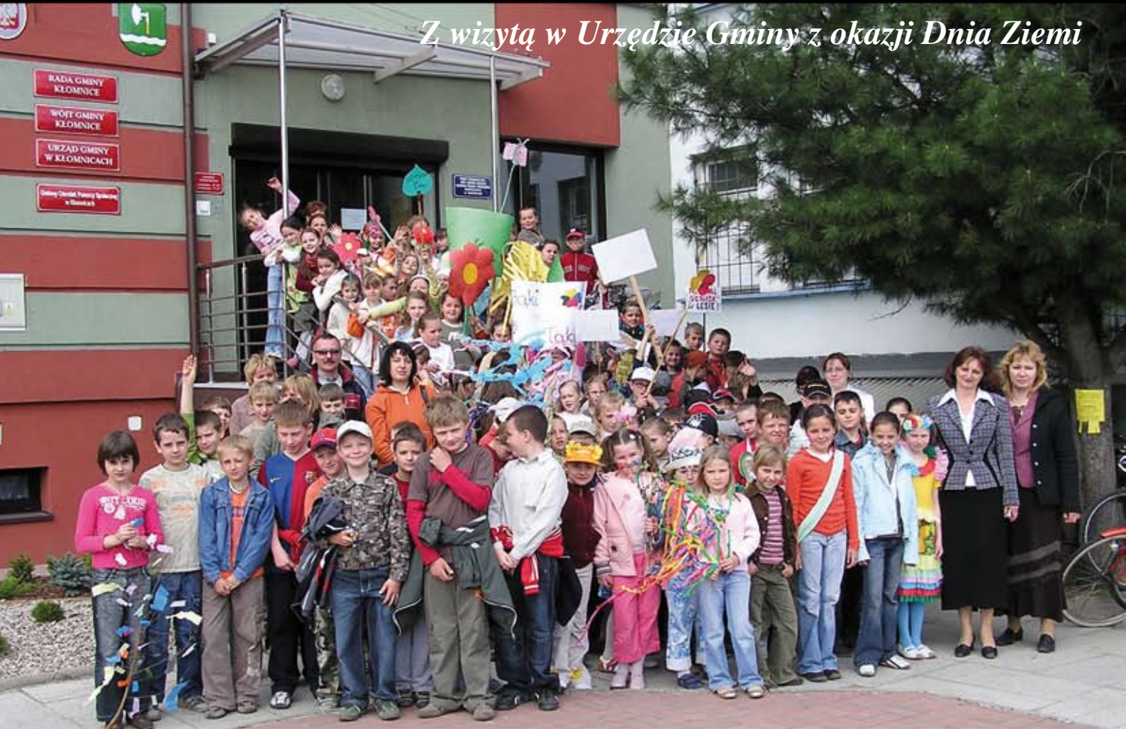
Z wizytą w Urzędzie Gminy z okazji Dnia Ziemi