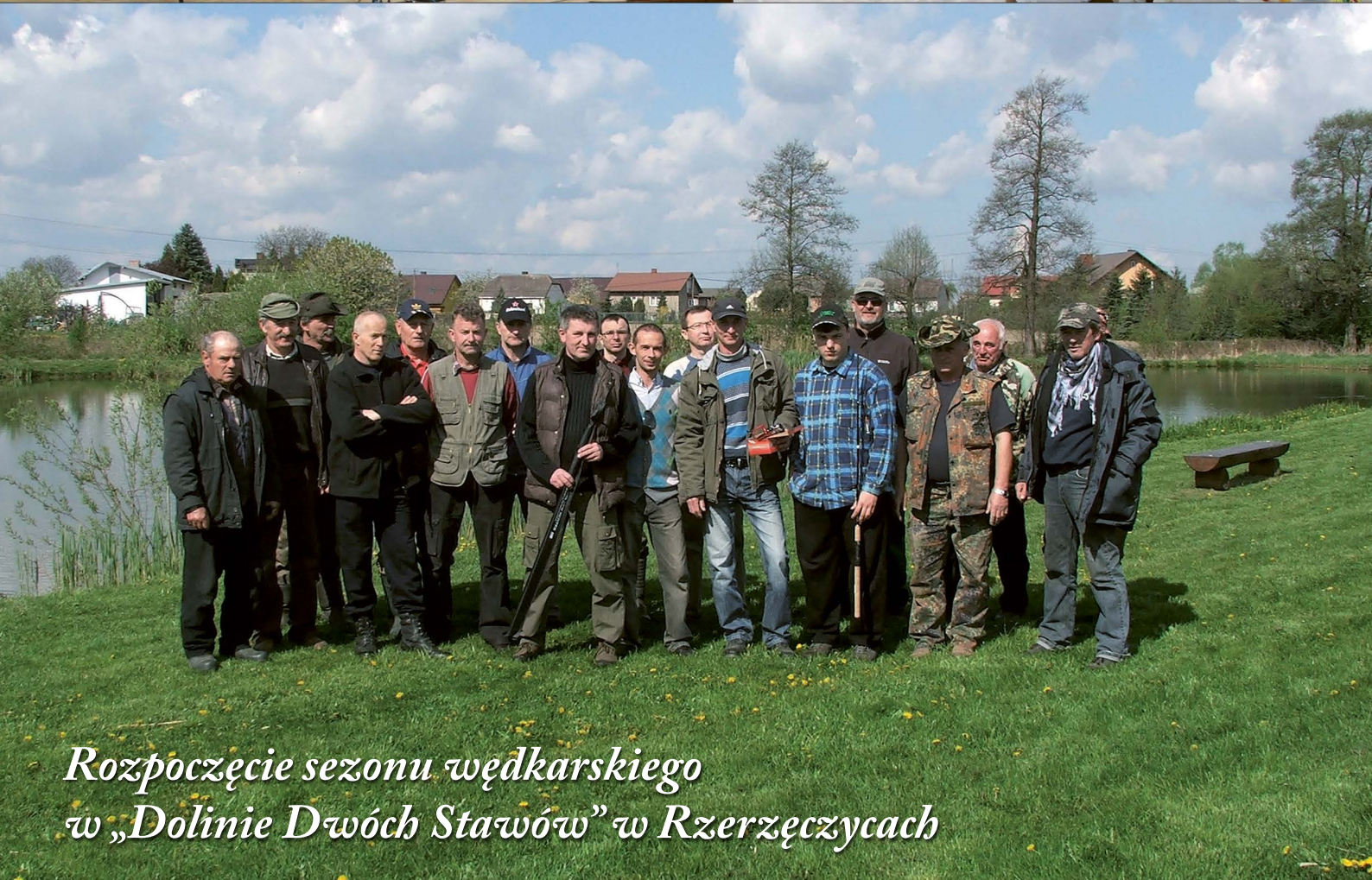
Rozpoczęcie sezonu wędkarskiego w „Dolinie Dwoch Stawów” w Rzerzeczycach