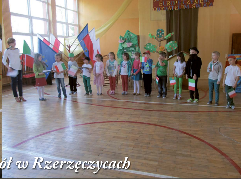
Dzień Europejski w Zespole Szkół w Rzerzęcicach