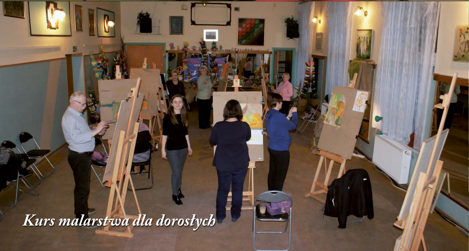
Kurs malarstwa dla dorosłych