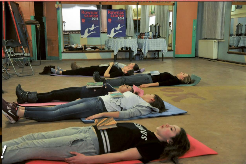
Warsztaty teatralne w GOKu!