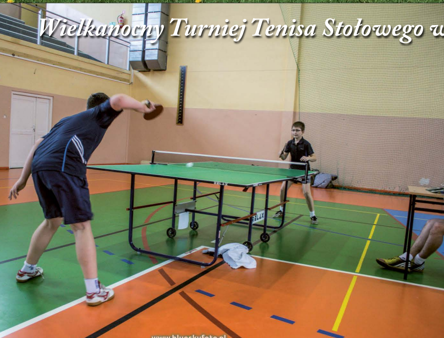
Wielkanocny Turniej Tenisa Stołowego w Kłomnicach