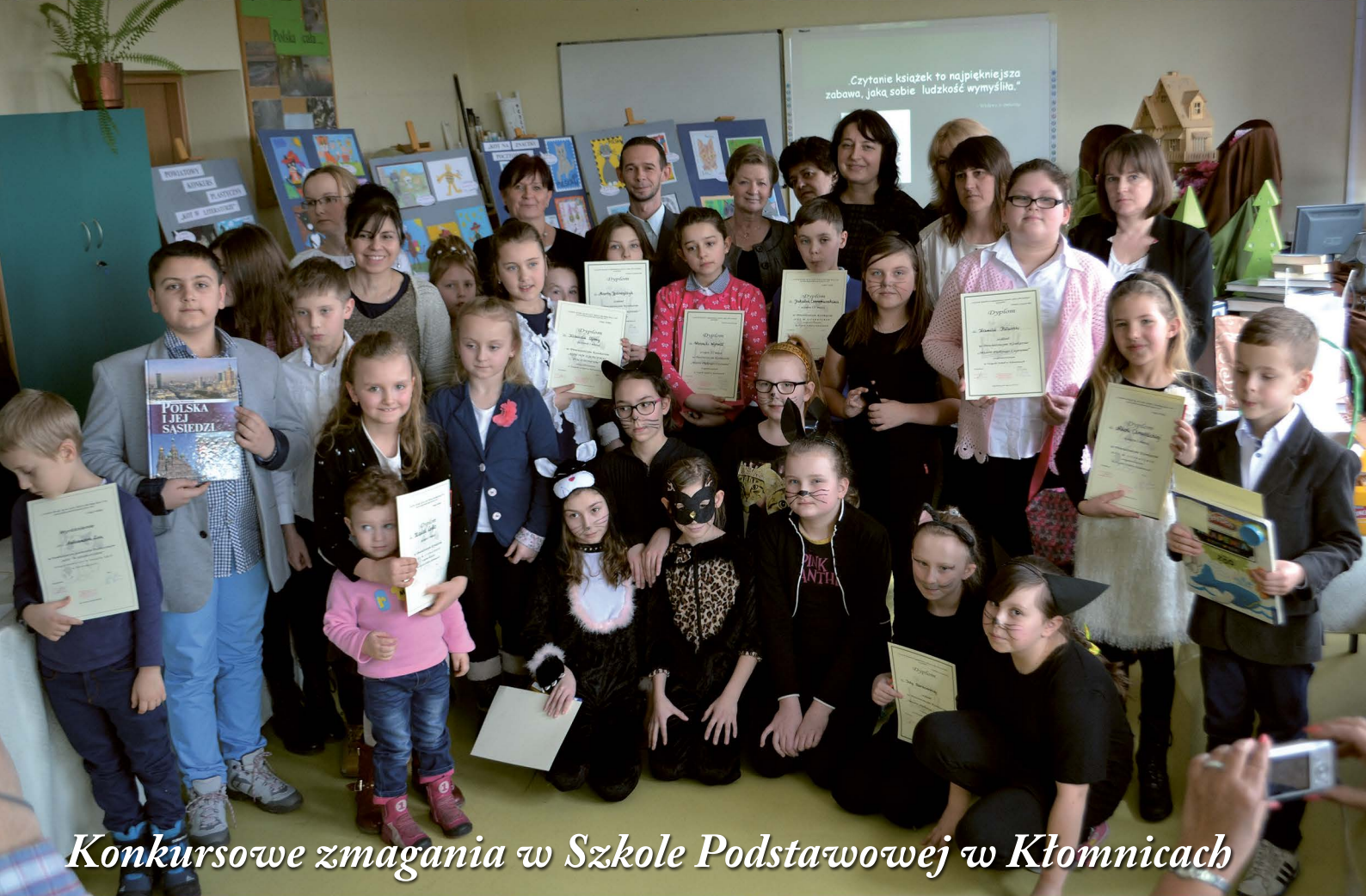
Konkursowe zmagania w Szkole Podstawowej w Kłomnicach