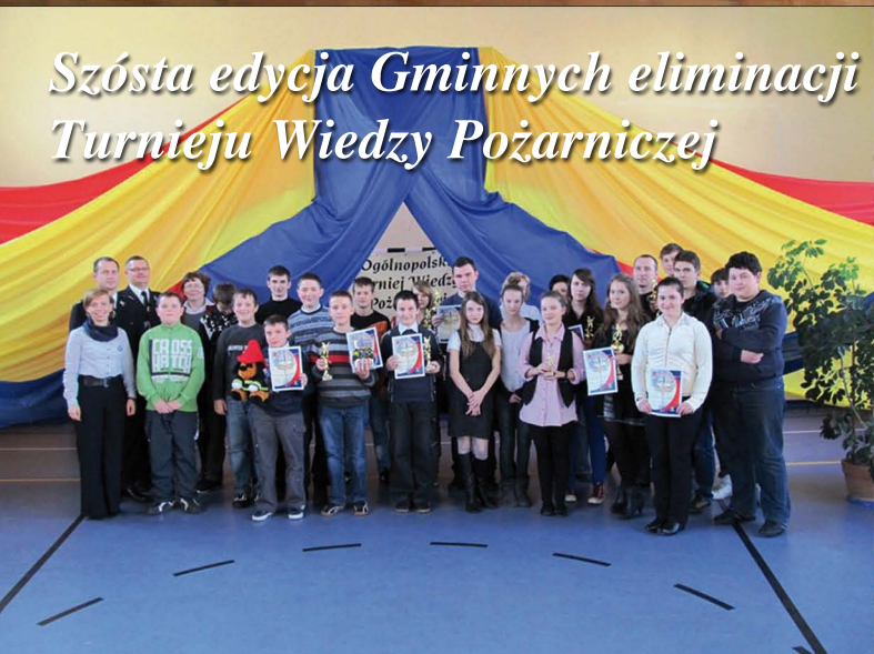
Szósta edycja Gminnych eliminacji Ogólnopolskiego Turnieju Wiedzy Pożarniczej