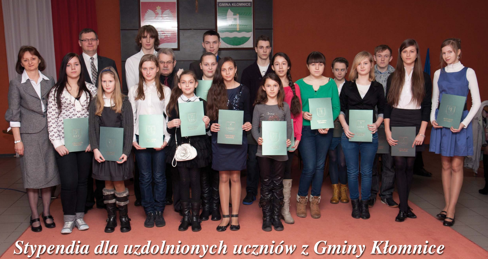
Stypendia dla uzdolnionych uczniów z Gminy Kłomnice