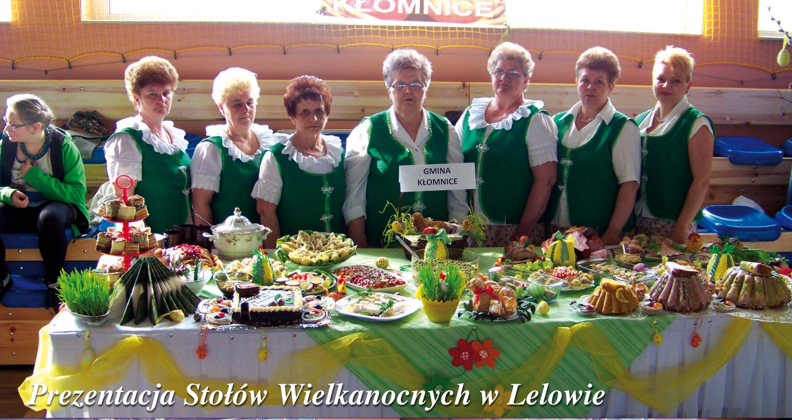
Prezentacja Stołów Wielkanocnych w Lelowie