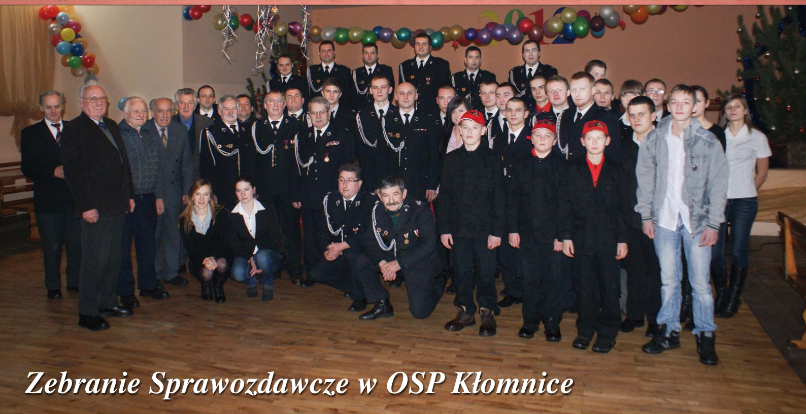
Zebranie Sprawozdawcze w OSP Kłomnice