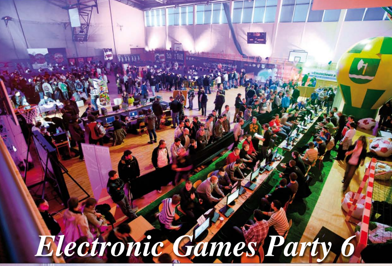
Electronic Games Party 6