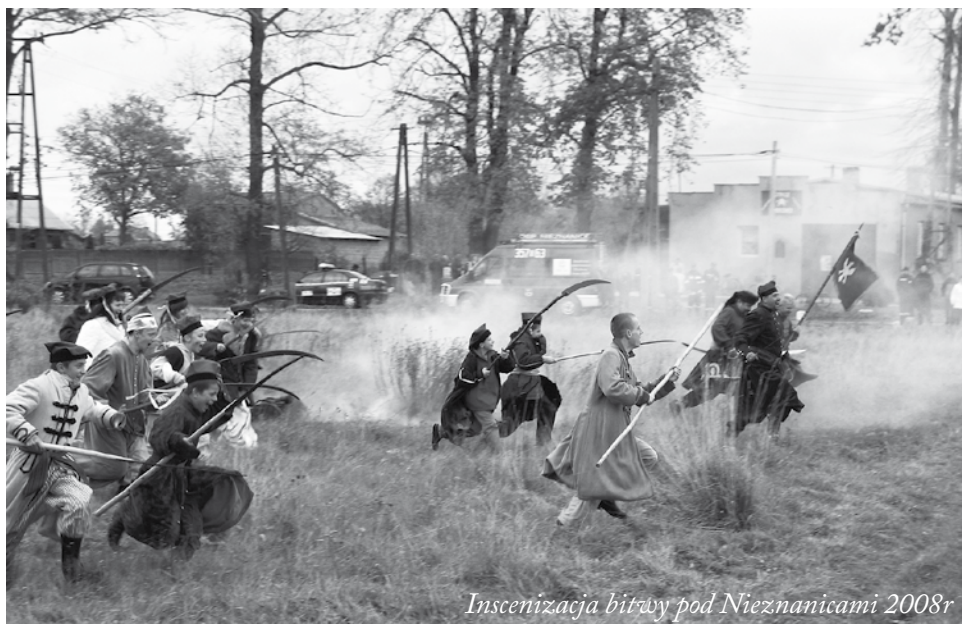
Inszenizacja bitwy pod Nieznanicami 2008r

Właśnie Chorzenalia pomyślane jako święto społeczności lokalnych miały bardzo spektakularny charakter. W ramach tego lokalnego festynu odbywającego się w na terenie Parku Domu Dziecka w remizy OSP w Chorzenicach odbywały się finały konkursów „Kultura Młodych Twórców”, inscenizacje bitwy pod Nieznanicami z Powstania Styczniowego, a nawet wybiliśmy specjalną monetę – denar św. Stanisława „Księstwa NieWitChorz”. Nieco w cieniu tych wydarzeń toczyły się spotkania - sesje tematyczne pod nazwą „Nowoczesna wieś woj. Śląskiego – drogi do sukcesu”. W sumie było ich cztery, w tym to ostatnie poświęcone rodzinie, o którym wspominałem przy okazji uroczystych obchodów jubileuszowych. Na pozostałych dyskutowaliśmy o kulturze, przedsiębiorczości i samorządności, a jednym z gości