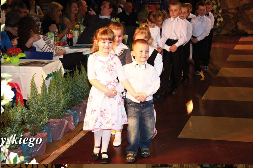
IX Ogólnopolski Turniej Tańca Towarzyskiego o Puchar Wójta Gminy Kłomnice