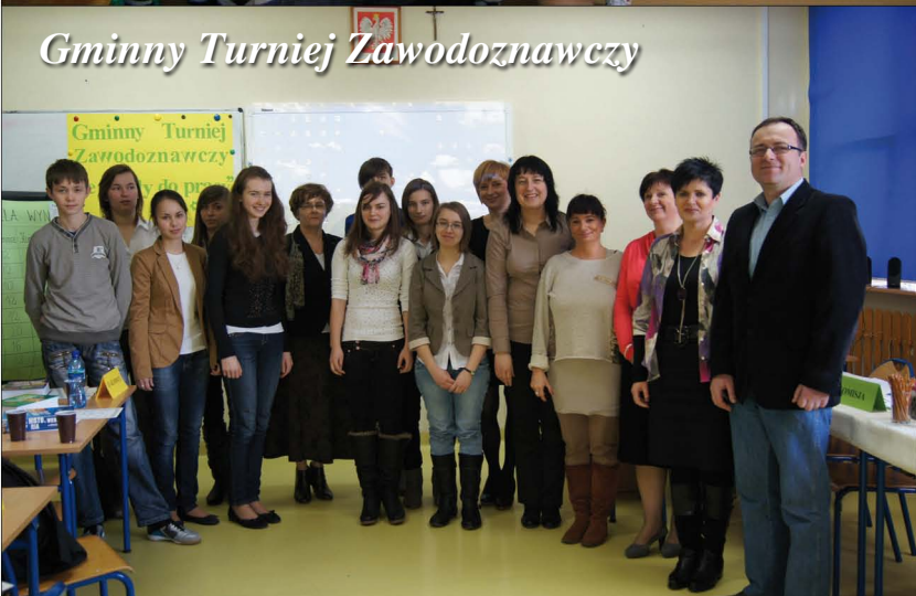
Gminny Turniej Zawodowca