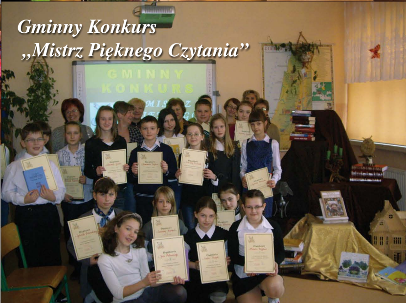
Gminny Konkurs „Mistrz Pięknego Czytania”