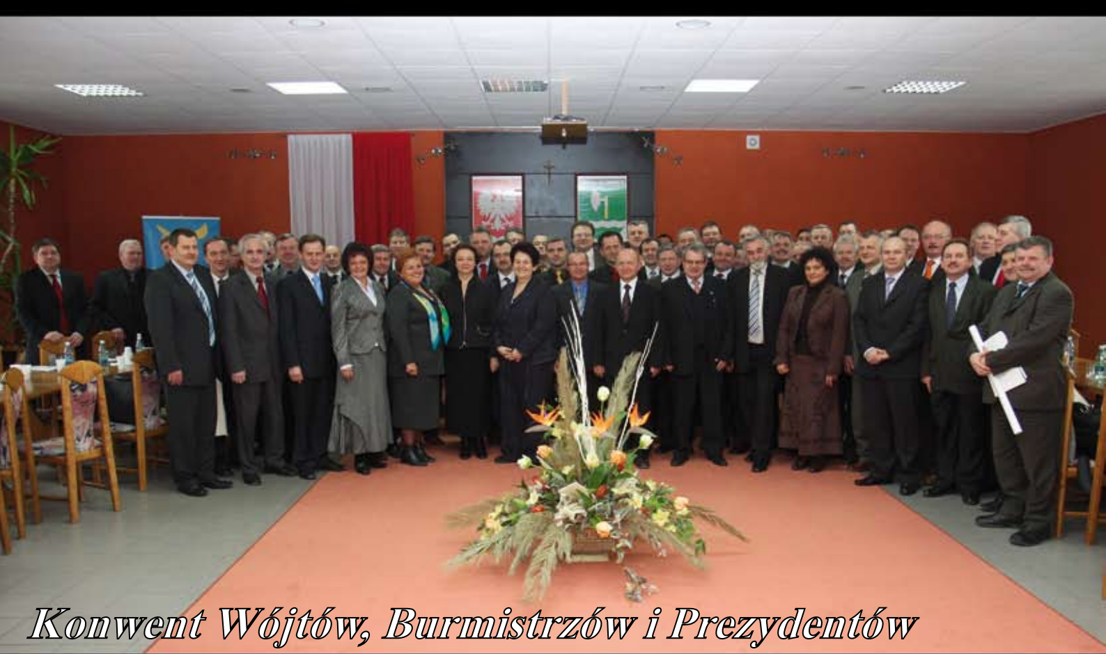
Konwent Wójtów, Burmistrzów i Prezydentów