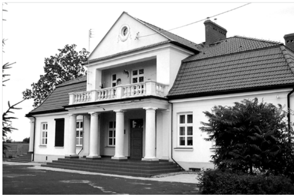
Dworek w Kościelcu