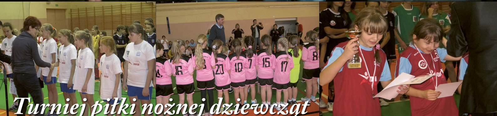
Turniej piłki nożnej dziewcząt