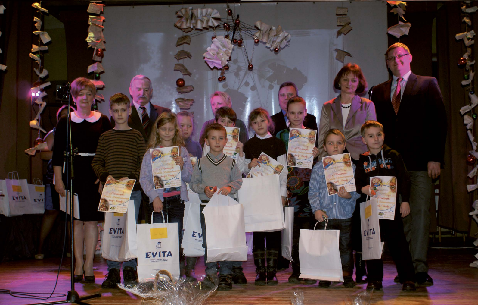
Najlepsi profesjonalni amatorzy w Powiatowym Konkursie!