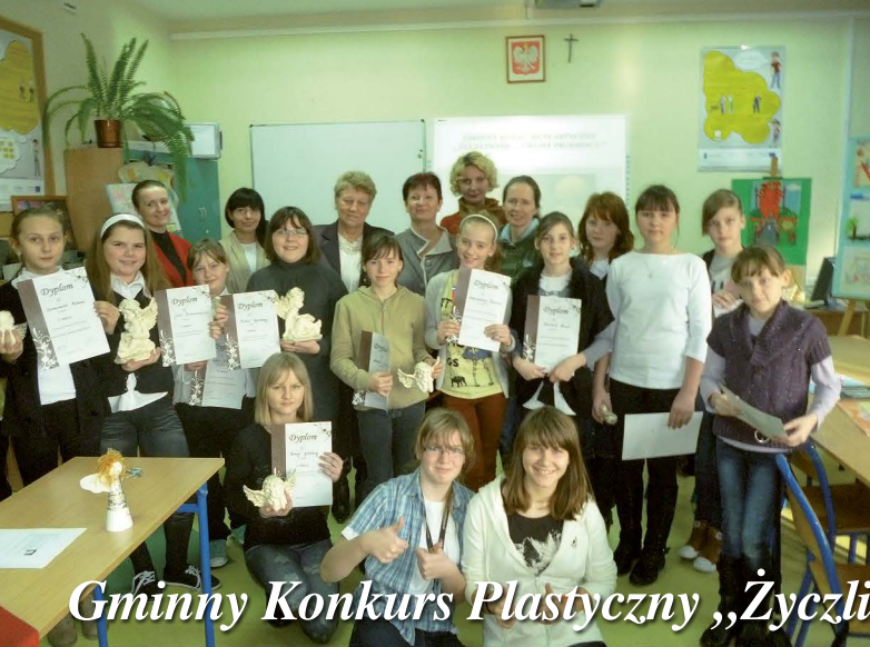
Gminny Konkurs Plastyczny „Życzliwość Zamiast Przemocy!”