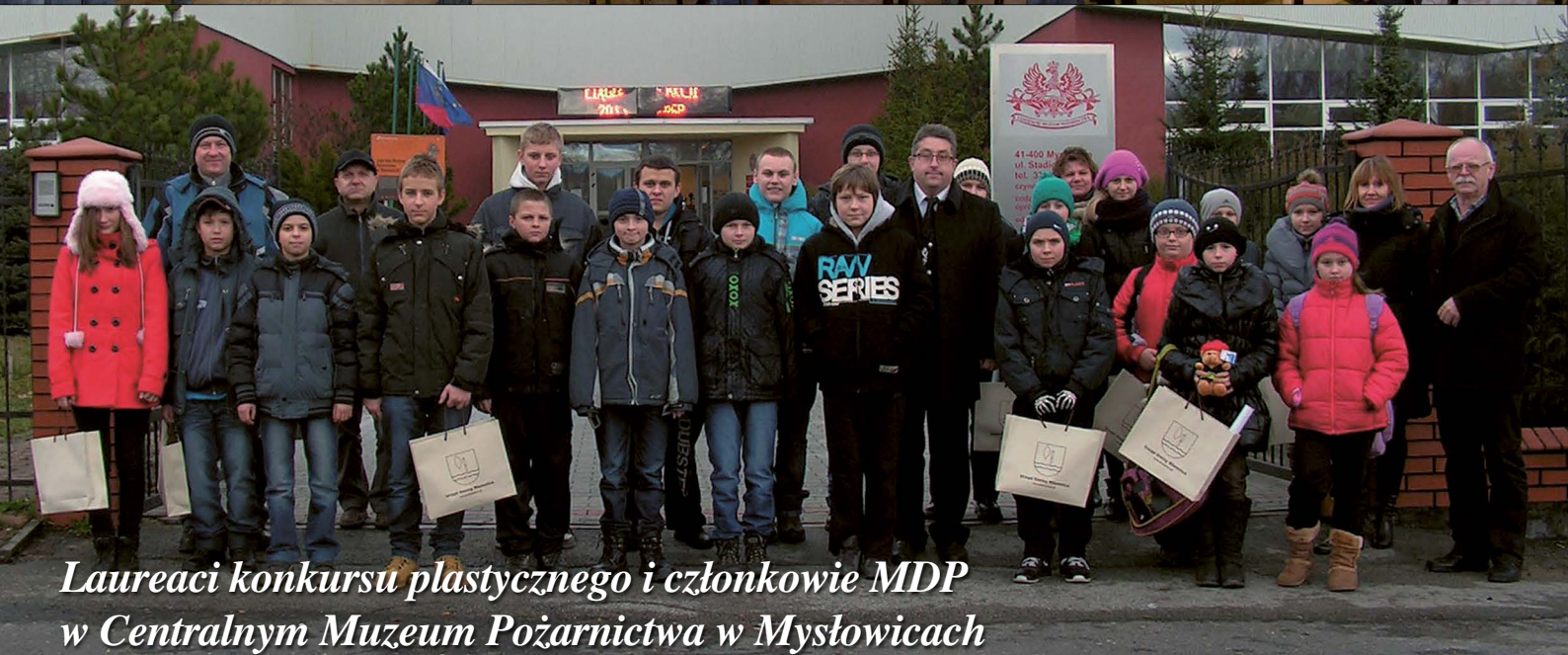
Laureaci konkursu plastycznego i członkowie MDP w Centralnym Muzeum Pożarnictwa w Mysłowicach