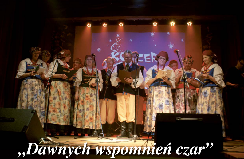
„Dawnych wspomnień czar”