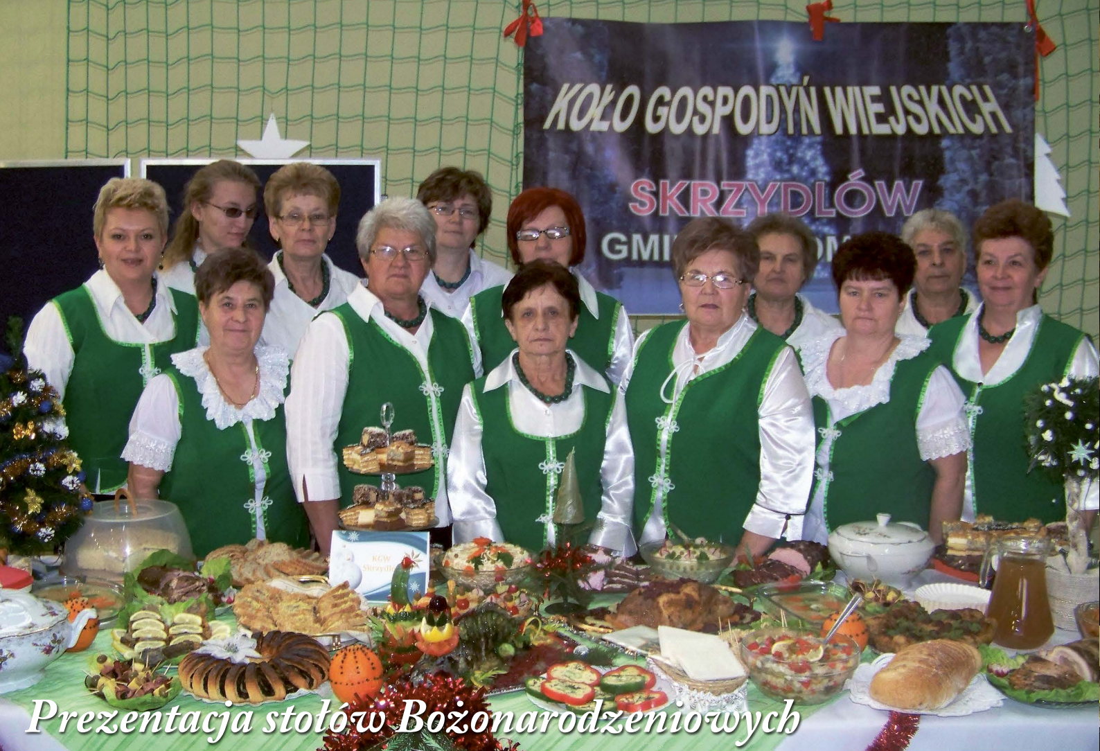
Prezentacja stołów Bożonarodzeniowych