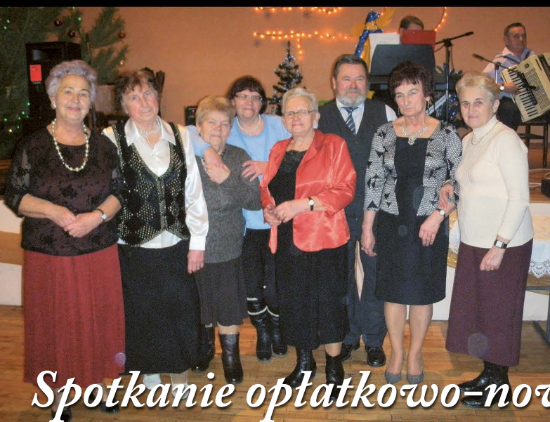
Spotkanie opłatkowo-noworoczne emerytów