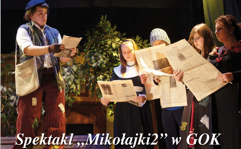
Spektakl „Mikołajki2” w GOK