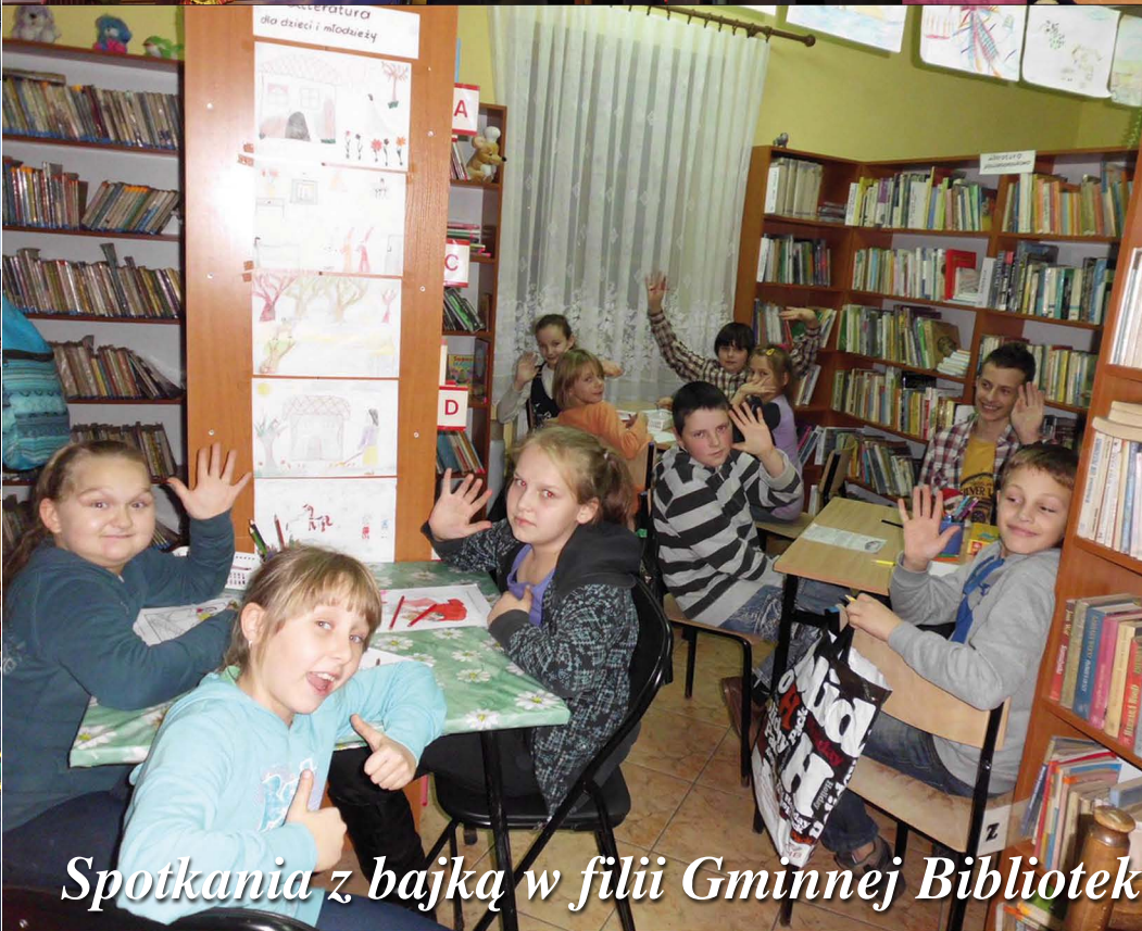
Spotkania z bajką w filii Gminnej Biblioteki Publicznej w Garnku