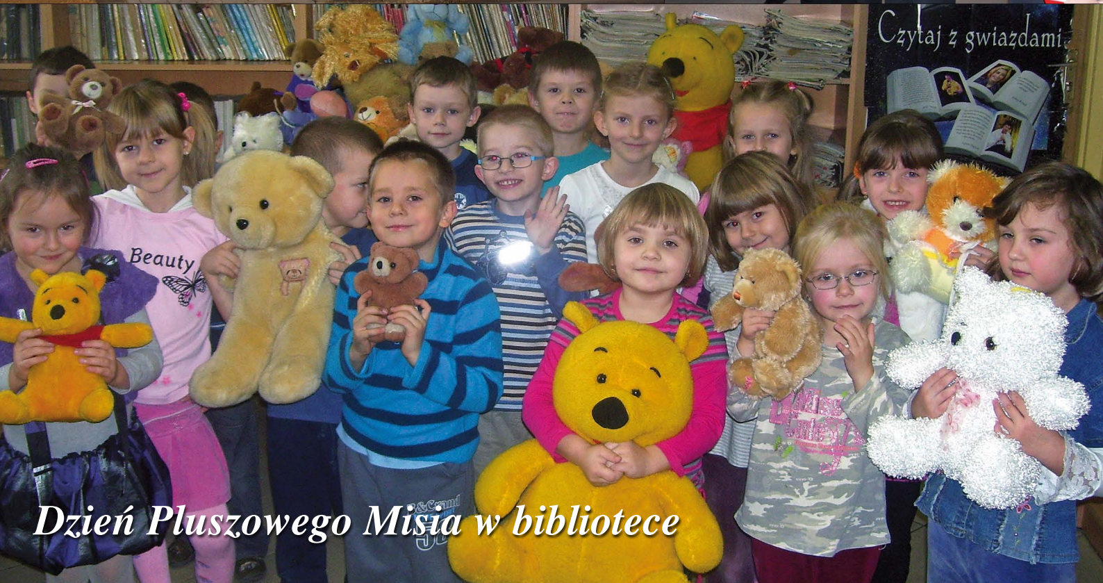
Dzień Pluszowego Misia w bibliotece