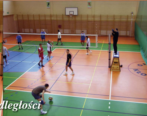
11 listopada - Turniej Niepodległości