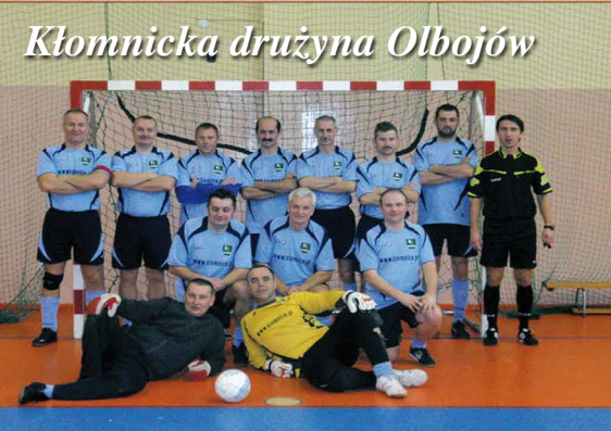
Kłomnicka drużyna Olbojów