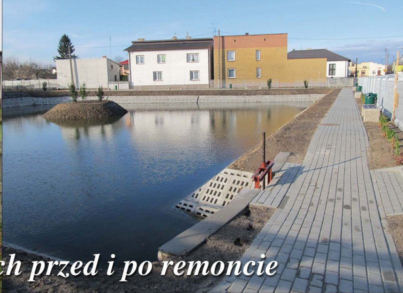
Zbiornik wodny w Kłomnicach przed i po remoncie