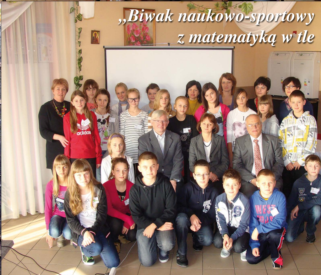
„Biwak naukowo-sportowy z matematyką w tle