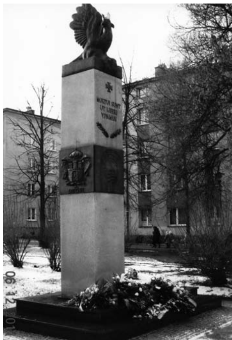
Pomnik Orląt Lwowskich w Częstochowie

Po uzyskaniu zgody autora tego wystąpienia, które miało miejsce w Częstochowie, dnia 22 listopada 2011r. na Placu Orląt Lwowskich, pragnę zapoznać naszych czytelników z treścią - co obok czynię.