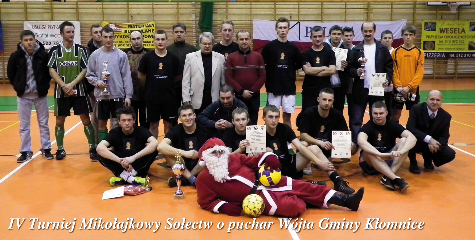
IV Turniej Mikołajkowy Sołectw o puchar Wójta Gminy Kłomnice