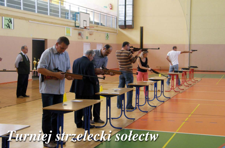
Turniej strzelecki sołectw