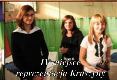
IV miejsce reprezentacja Kruszyny