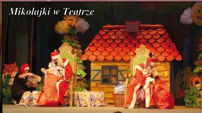
Mikołajki w Teatrze