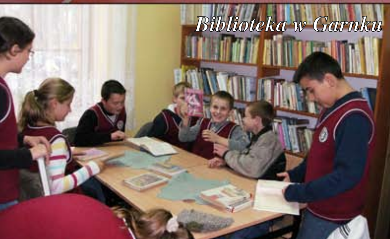
Biblioteka w Garnku