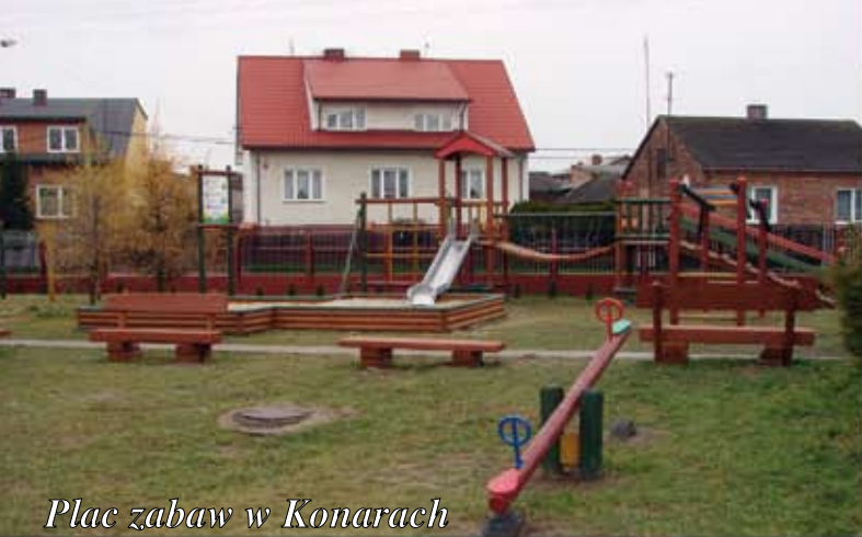
Plac zabaw w Konarach