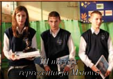
III miejsce reprezentacja Mstowa