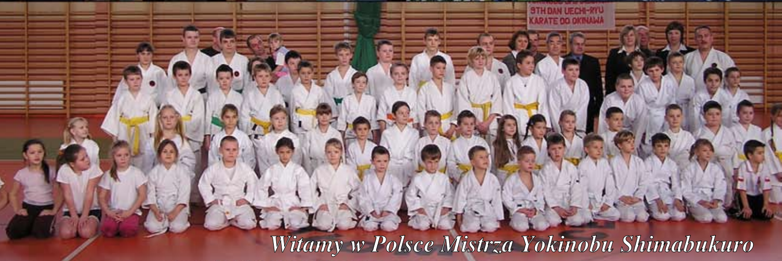
Witamy w Polsce Mistrza Yokinobu Shimabukuro