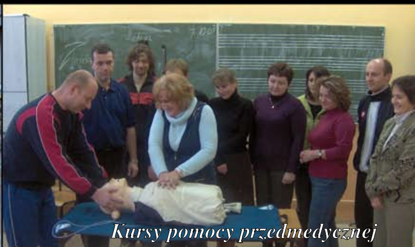
Kursy pomocy przedmedycznej