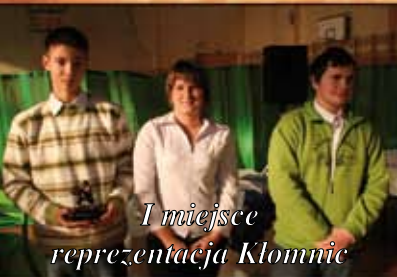
I miejsce reprezentacja Kłomnice