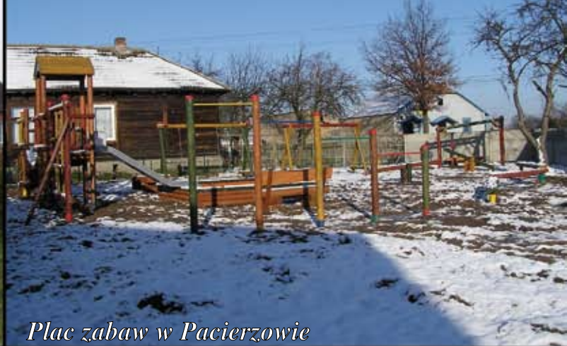
Plac zabaw w Pacierzowie