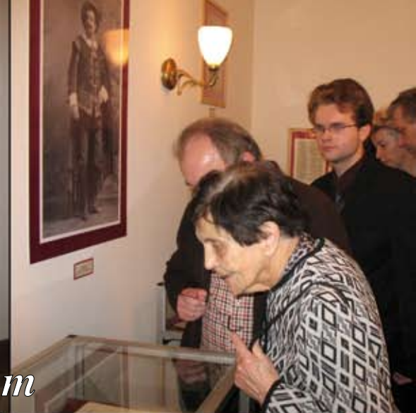
Święto Muzyki dedykowane Reszkom