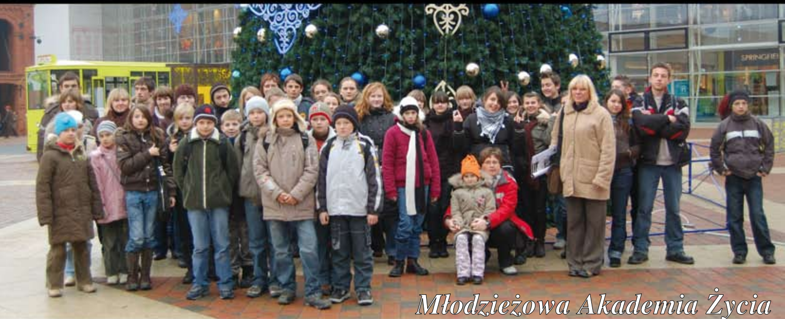
Młodzieżowa Akademia Życia