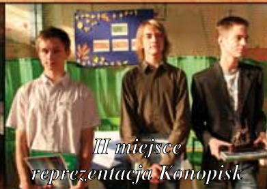
III miejsce reprezentacja Konopisk