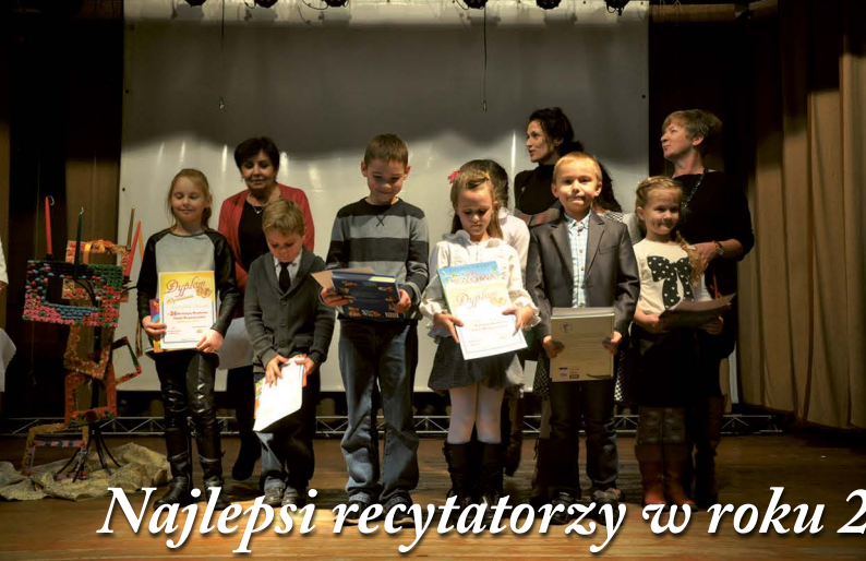
Najlepsi recytatorzy w roku 2013