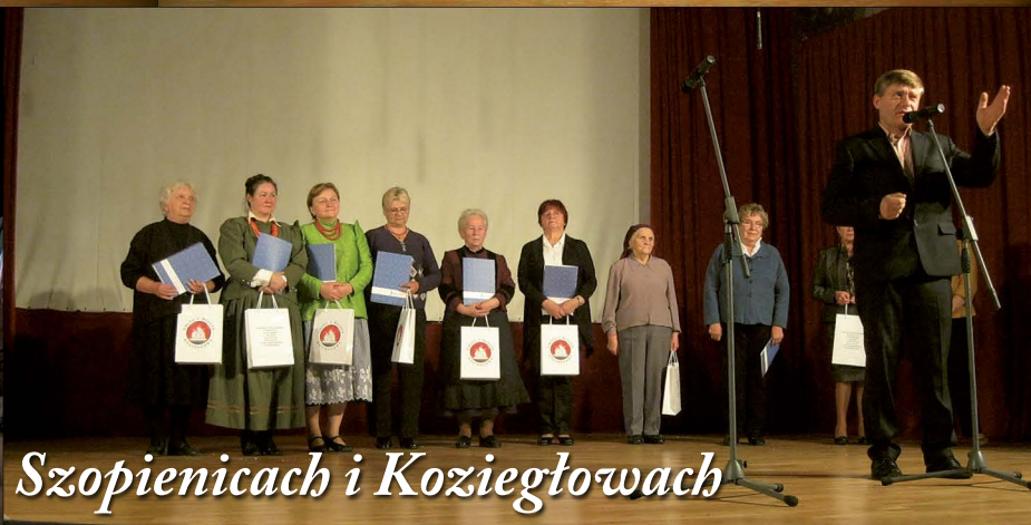
Z obrzędem w Katowicach Szopienicach i Koziegłowach