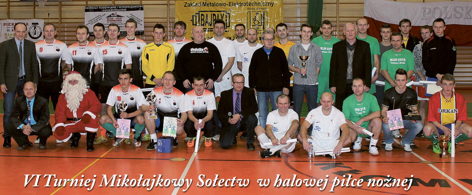
VI Turniej Mikolajkowy Sołectw w halowej piłce nożnej