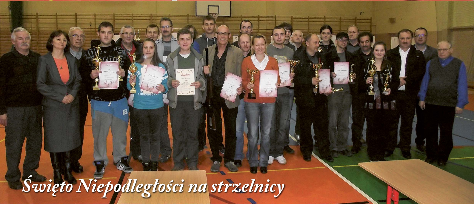
Święto Niepodległości na strzelnicy