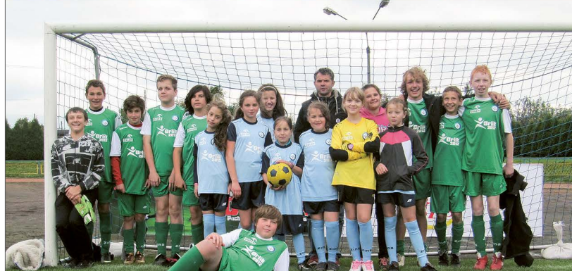
III miejsce dziewcząt młodszych w Województwie Śląskim