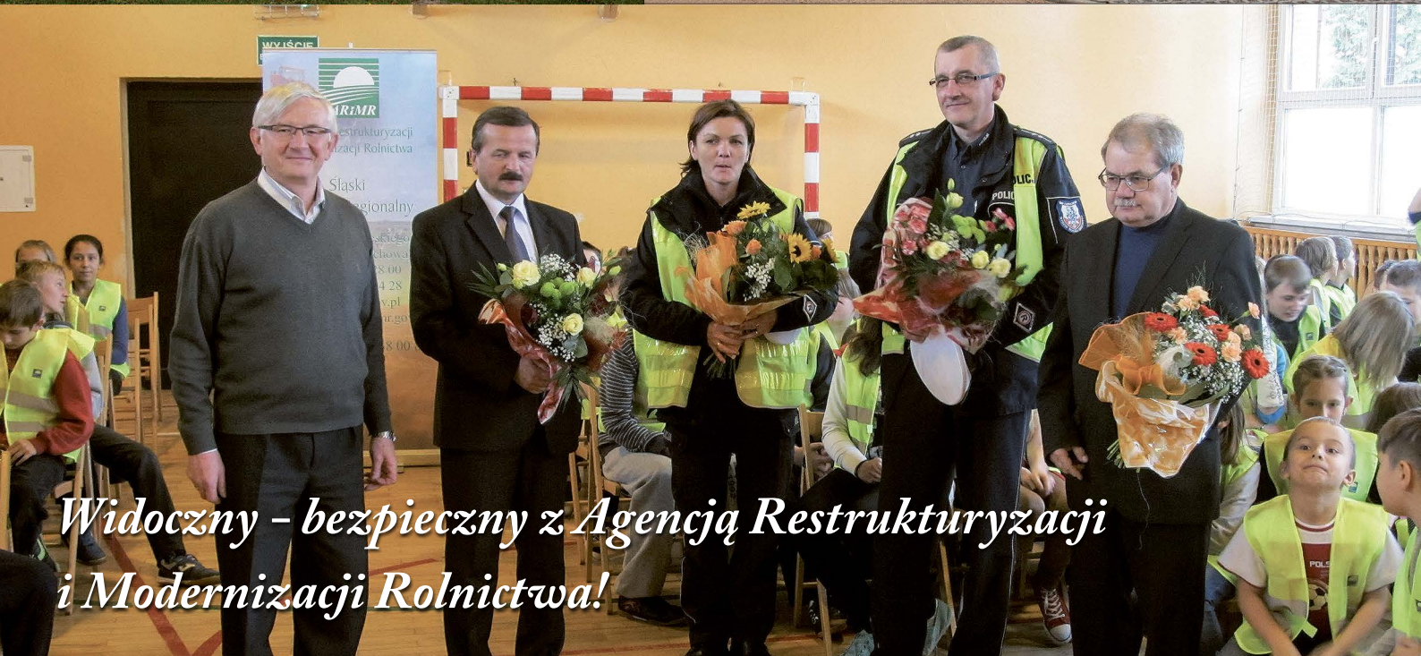
Widoczny - bezpieczny z Agencją Restrukturyzacji i Modernizacji Rolnictwa!