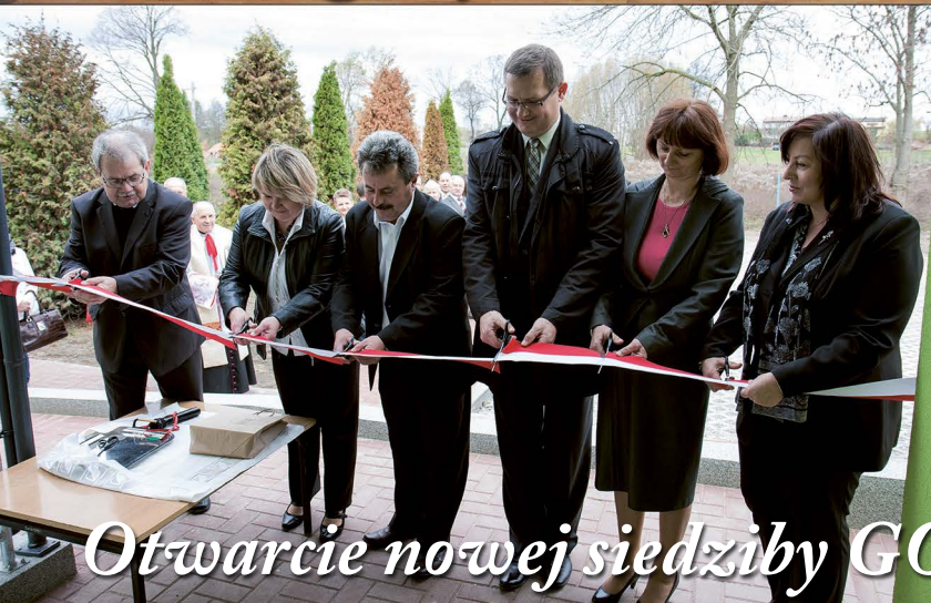
Otwarcie nowej siedziby GOPS w Zdrowej