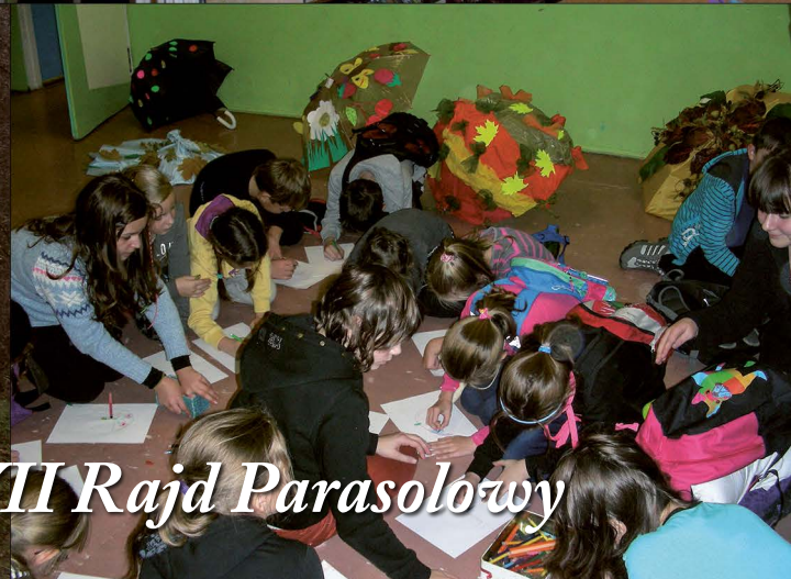
Ciekawe formy turystyki – XVII Rajd Parasolowy