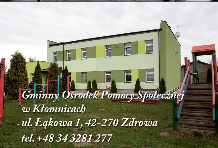
Gminny Ośrodek Pomocy Społecznej w Kłomnicach ul. Łąkowa 1, 42-270 Zdrowa tel. +48 34 3281 277