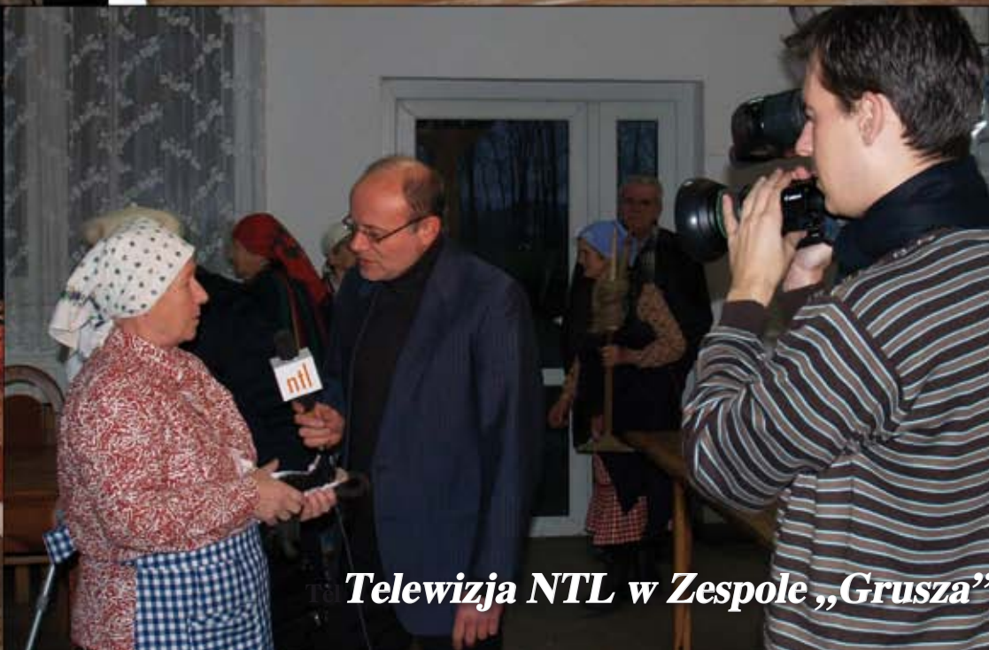
Telewizja NTL w Zespole „Grusza”