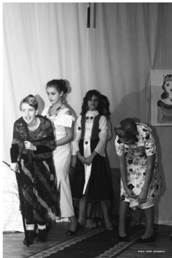
Teatr ze szkoły w SkrzydlowieKłomnice

my pełniej niosąc pomoc i dzielmy się nawet najmniejszym dobrem - Aniołami i Piernikami Bożonarodzeniowymi. Do zobaczenia na wystawie i uroczystym rozdaniu nagród w dniu 20 grudnia (Niedziela) sala widowiskowa GOK w Kłomnicach. Zapraszamy!!