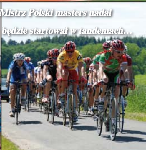
Mistrz Polski masters nadal będzie startował w tandemach...