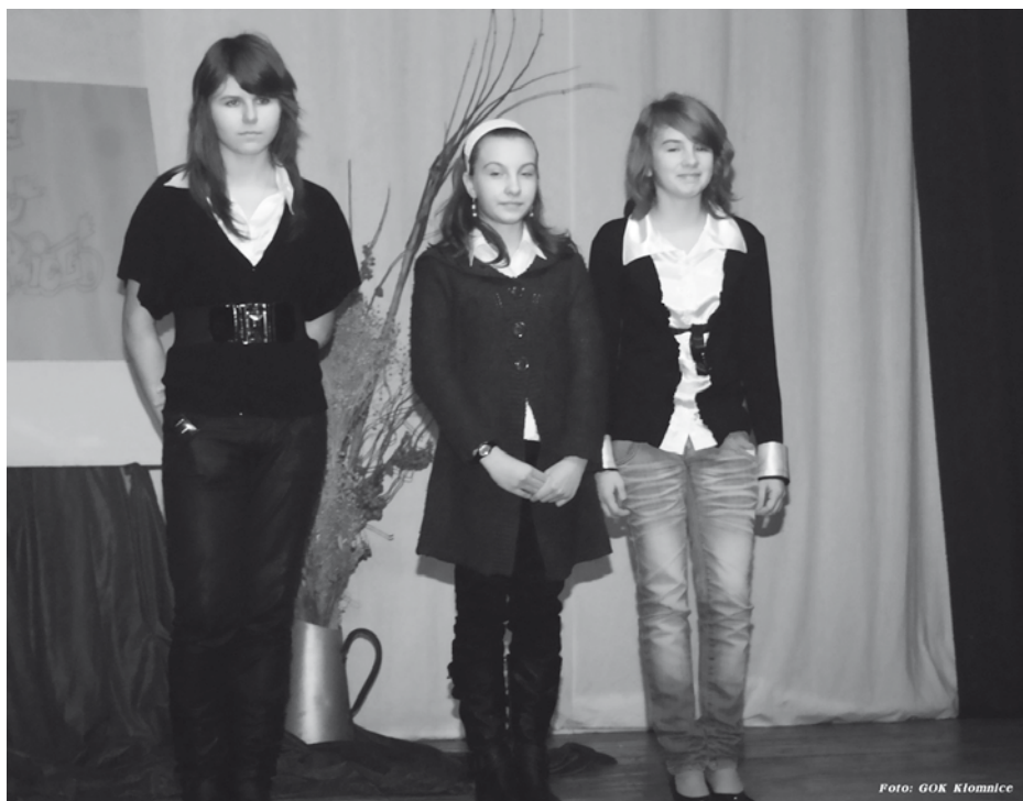
Laureatki Gminnego Konkursu Recytatorskiego

Jesteśmy pewni, że z satysfakcją podejmiemy się organizacji kolejnej edycji Przeglądu Małych Form Teatralnych „Opowiem Ci bajkę” w 2010 roku. Bo jest warto, by ocalić od zapomnienia formy teatralne, i dla integracji!