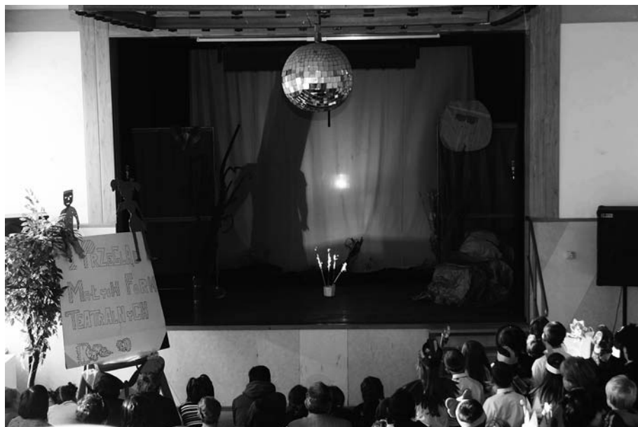
Przegląd Małych Form Teatralnych - Teatr cieni z GOK Kłomnice

Przyjemnie jest oglądać ten spektakl, żywy i barwny teatr obrzędowy. Rekwizyty, stroje, dobre humory i porozumienie aktorów, więcej aktorów wielopokoleniowych, występują bowiem dwie młode dziewczyny, wnuczki pań z Zespołu Obrzędowego „Grusza”. Zdjęcia i nowe widowisko jest dowodem kreatywności zespołu. Przypomnieniem rzadko podejmowanych tematów, związanych z wsią. Dlatego Wiejski Teatr Obrzędowy. Pragnę z radością wszystkich poinformować, że Zespół otrzymał jedno z trzech II miejsc - nagroda ufundowana przez Samorząd Marszałkowski. Przed Zespołem Grusza na I miejscu uplasował się Zespół „Cyganeczki” z Sygontki, gmina Przyrów. Również z zainteresowaniem i podziwem oglądałam widowiskowo wystawione przez Zespół Obrzędowy z Domu Opieki Społecznej w Częstochowie. Gratulujemy Ze-