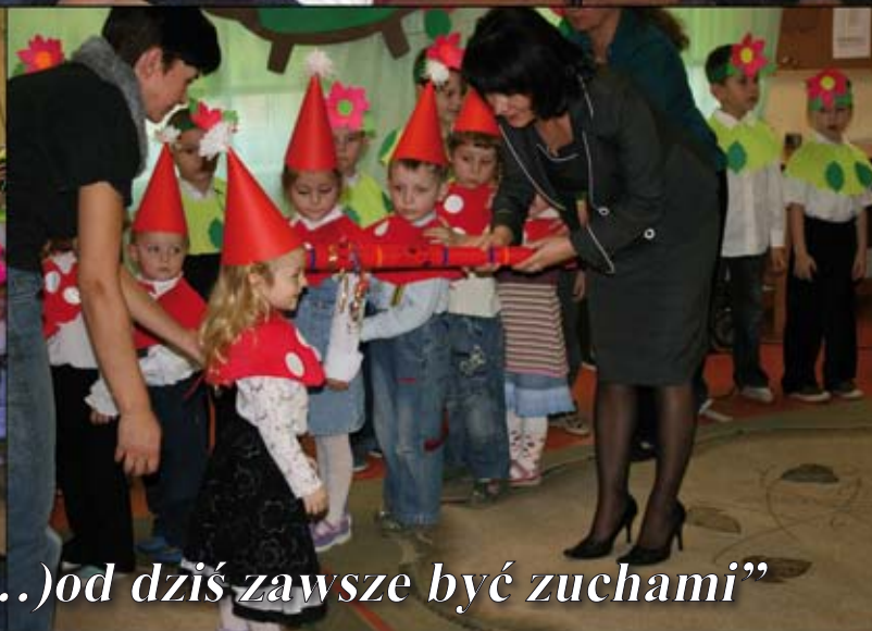
„My Maluchy przyrzekamy -(...)od dziś zawsze być zuchami”