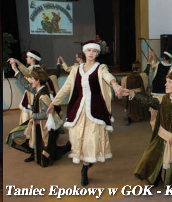
Taniec Epokowy w GOK - K