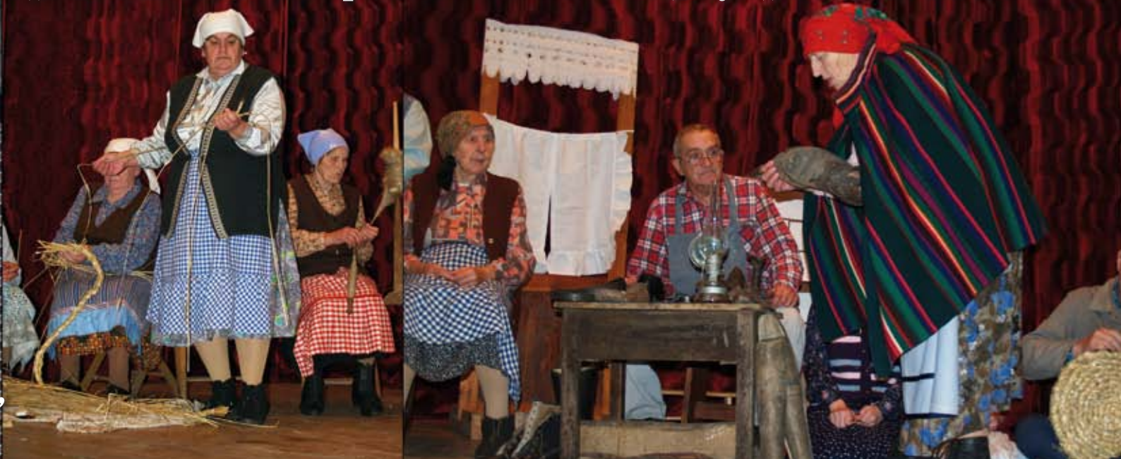
„Rozmaitości w chałupie u szewca Morcina”, czyli „Grusza” w Lelowie