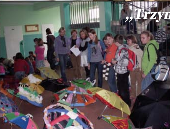
„Trzynastka pod parasolem”