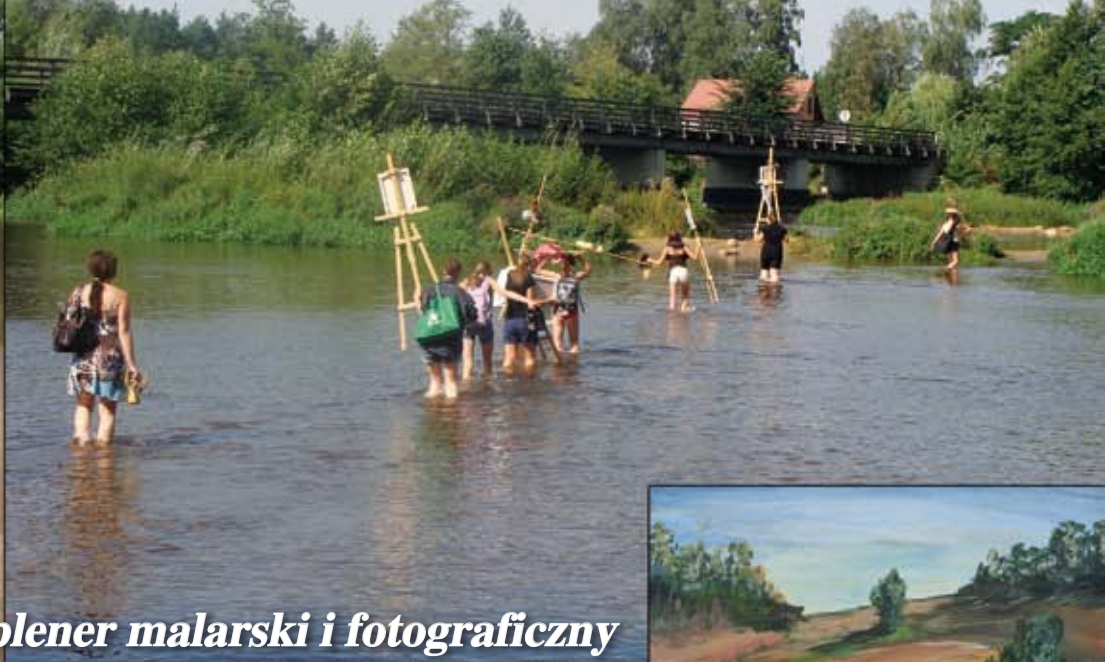
Wspomnienie lata - plener malarski i fotograficzny