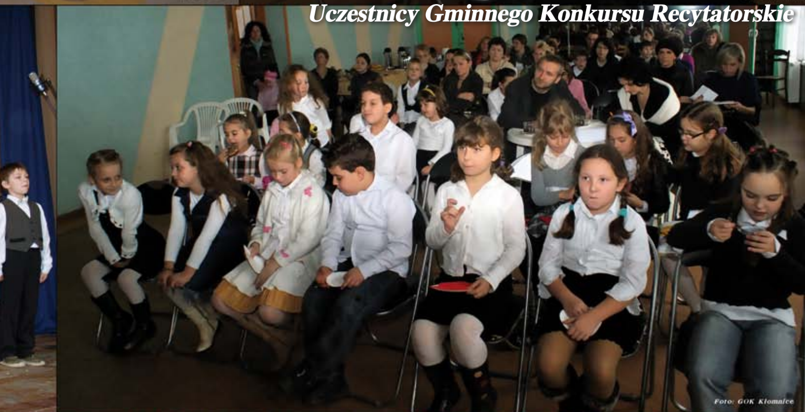
Uczestnicy Gminnego Konkursu Recytatorskiego