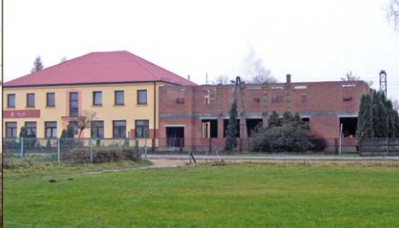
Rozbudowy szkoły c.d.