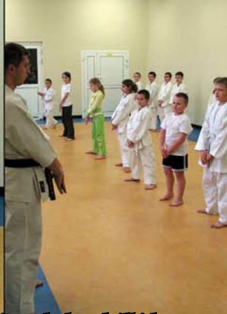
Sprawdzian umiejętności dzieci i młodzieży uczęszczających do szkoły karate