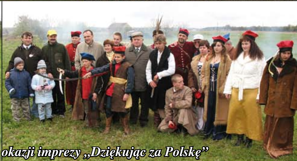
Inscenizacja bitwy z 1863 roku z okazji imprezy „Dziękując za Polskę”