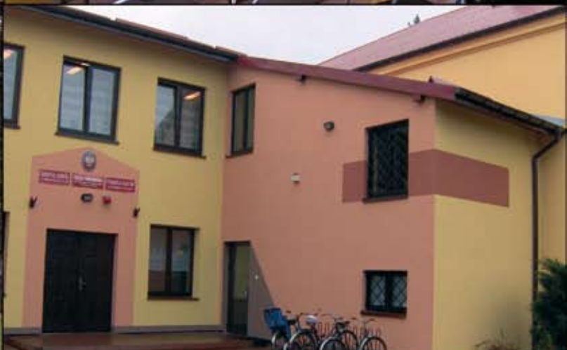
Rozbudowa Zespołu Szkół w Rzerzyczach na półmetku