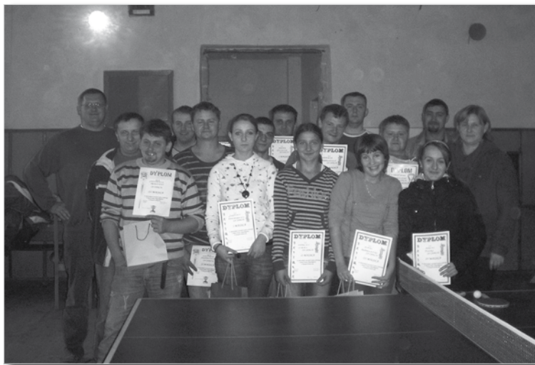
Uczestnicy Turnieju tenisowego