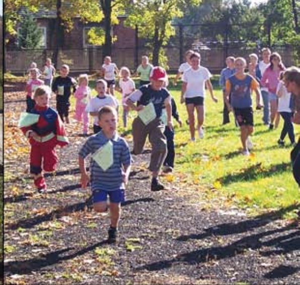
„Polska Biega” w Rzerzyczach