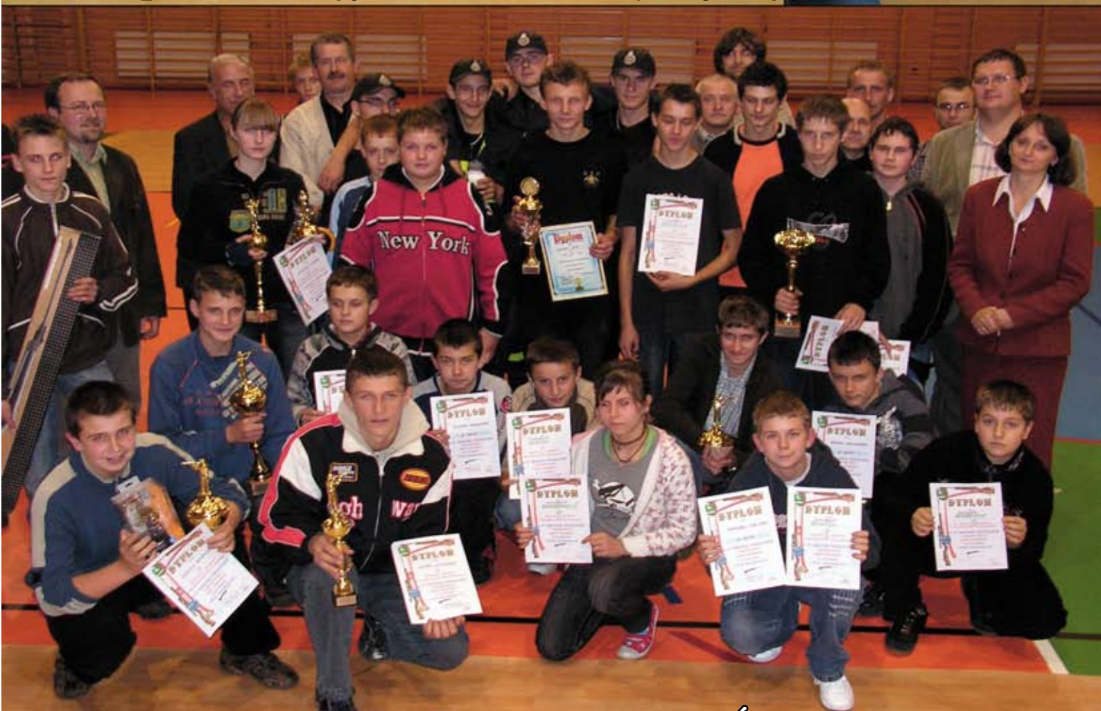
Zawody strzeleckie z okazji Święta Niepodległości