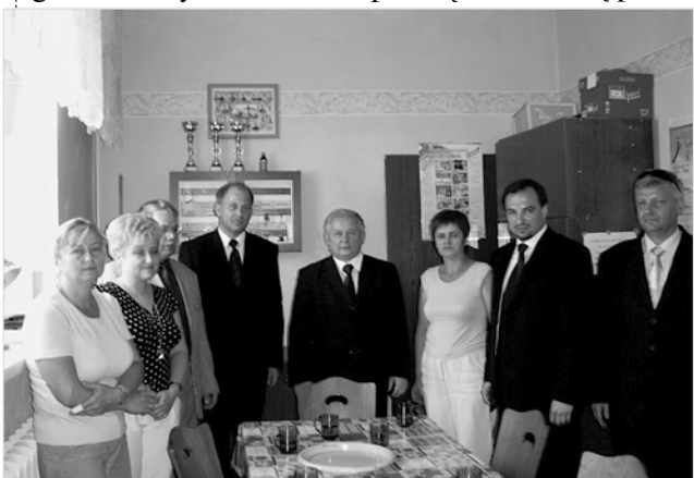
Spotkanie z premierem w szkole w Skrzydłowie

„Nigdy nie jest tak, żeby człowiek, czyniąc dobrze drugiemu, tylko sam był dobroczyńcą. Jest równocześnie obdarowywany, obdarowany tym, co ten drugi przyjmuje z miłością.”