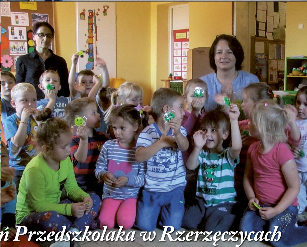
Ogólnopolski Dzień Przedszkolaka w Rzerzyczach