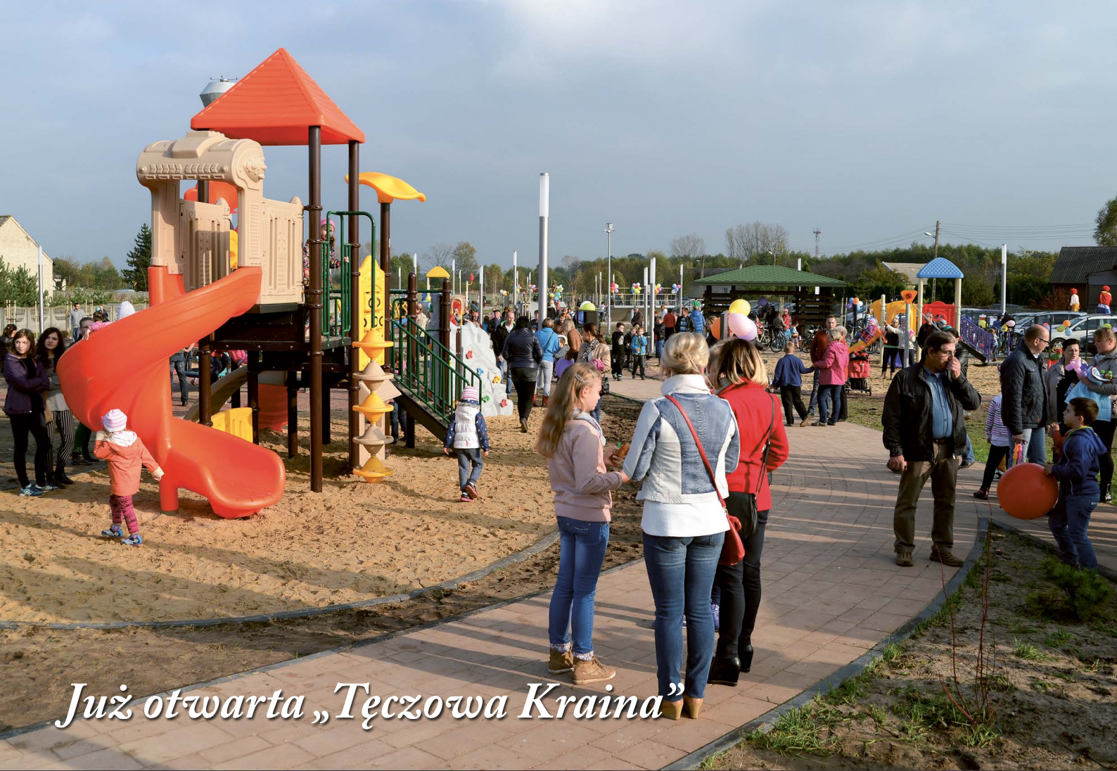
Już otwarta „Tęczowa Kraina”