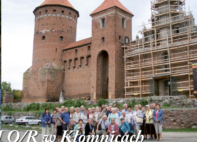
Wojazę członków PZERI O/R w Kłomnicach