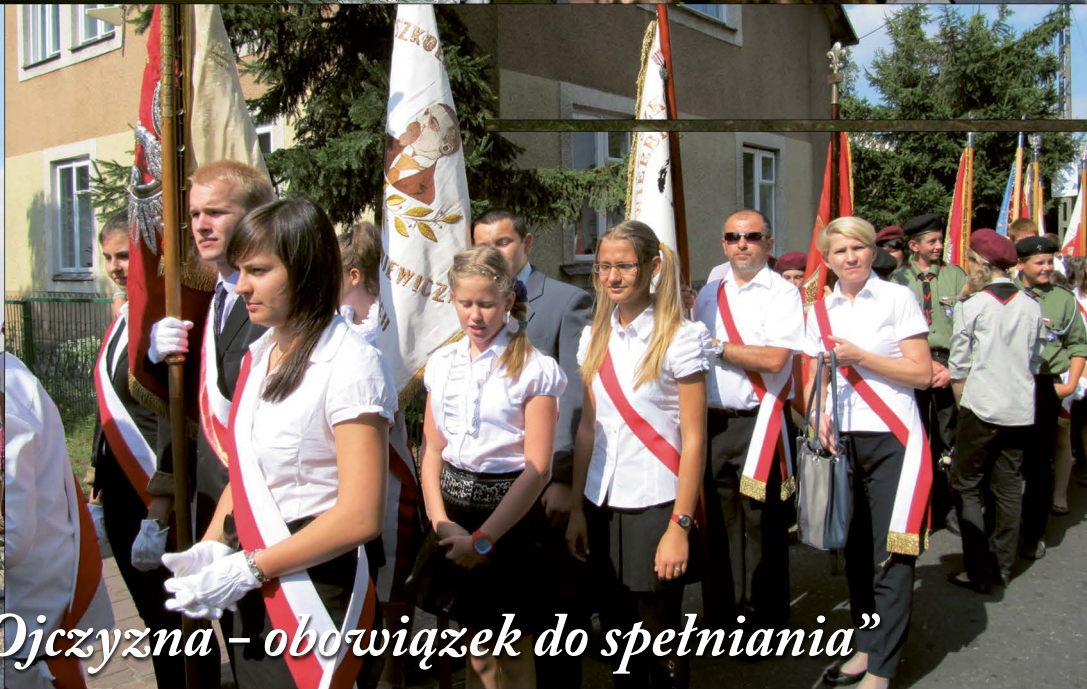
„Ojczyzna – obowiązek do spełniania”