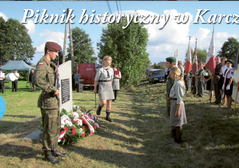
Piknik historyczny w Karczewicach