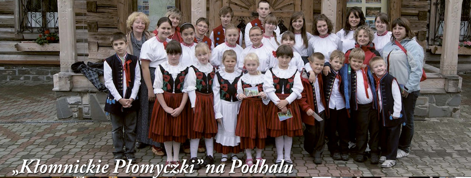
„Kłomnickie Płomyczki” na Podhalu