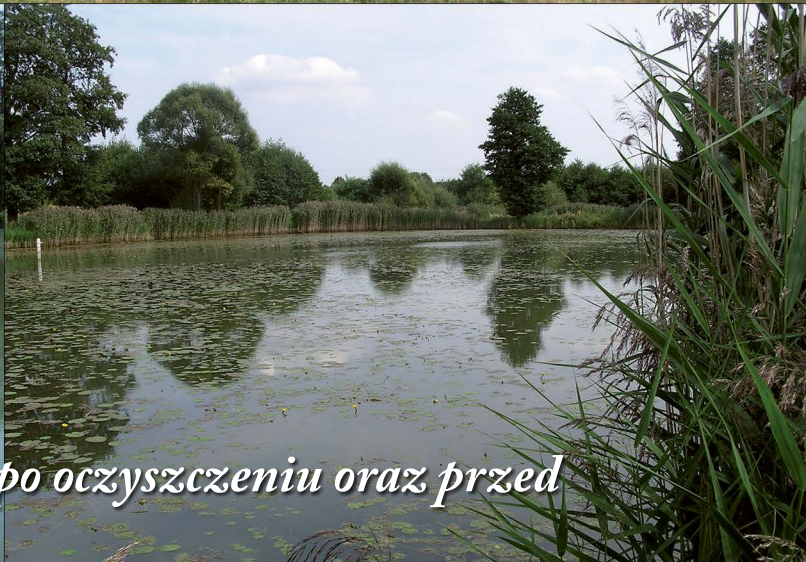
Jeden ze stawów w Rzerzyczkach po oczyszczeniu oraz przed