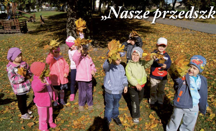
„Nasze przedszkole – szansą na sukces w szkole”