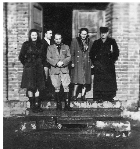
Grono nauczycielskie Szkoły Podstawowej w Zawadzie 1950 r.