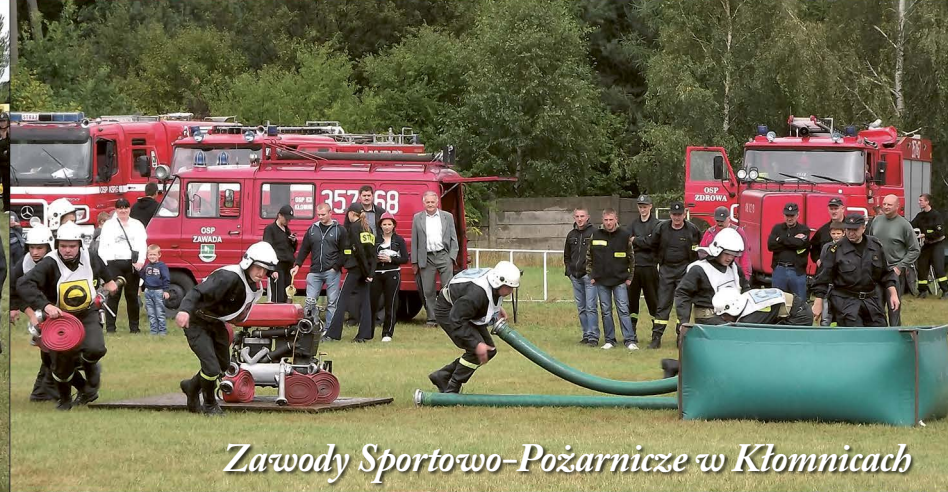
Zawody Sportowo-Pożarnicze w Kłomnicach