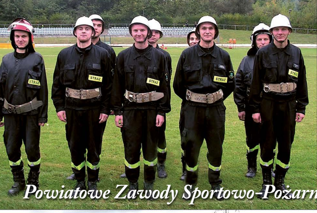
Powiatowe Zawody Sportowo-Pożarnicze