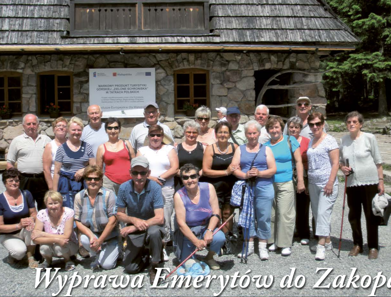
Wyprawa Emerytów do Zakopanego