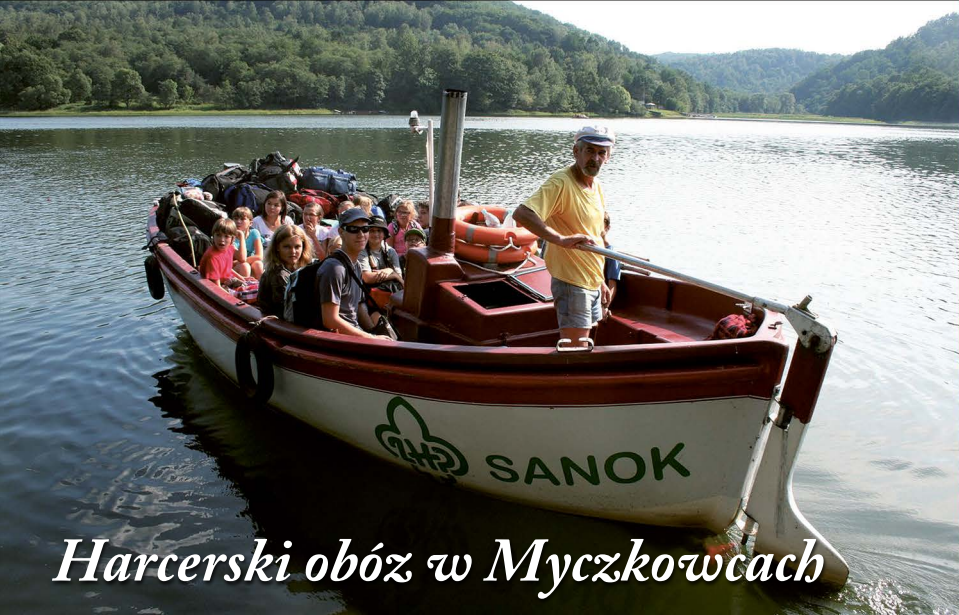
Harcerski obóz w Myczkowcach