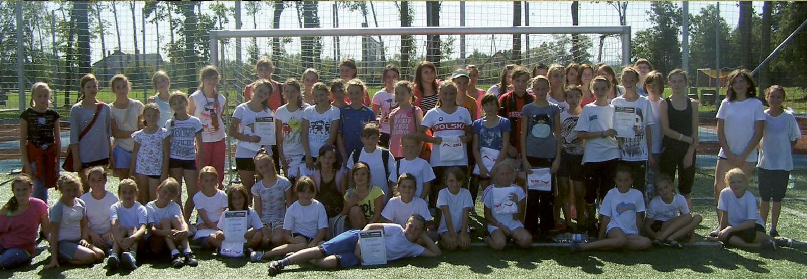
III Turniej Orlika o Puchar Premiera Donalda Tuska w Rzerzeczycach