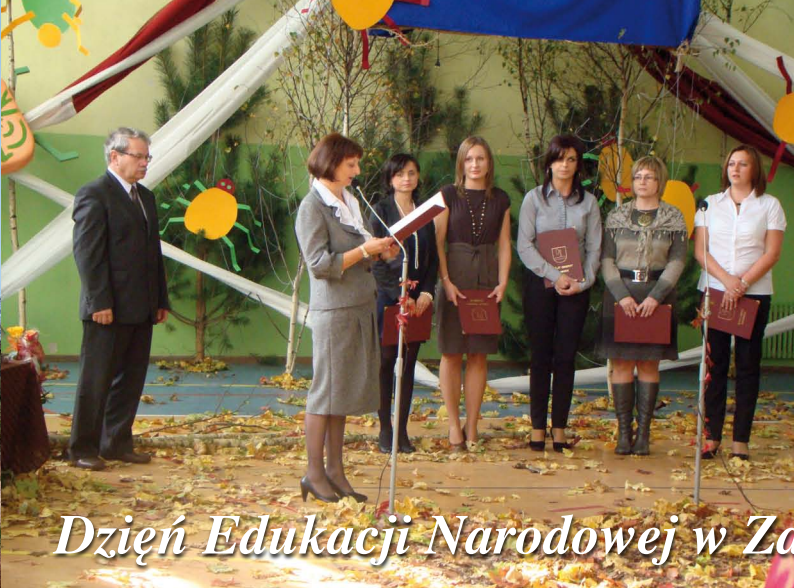
Dzień Edukacji Narodowej w Zawadzie