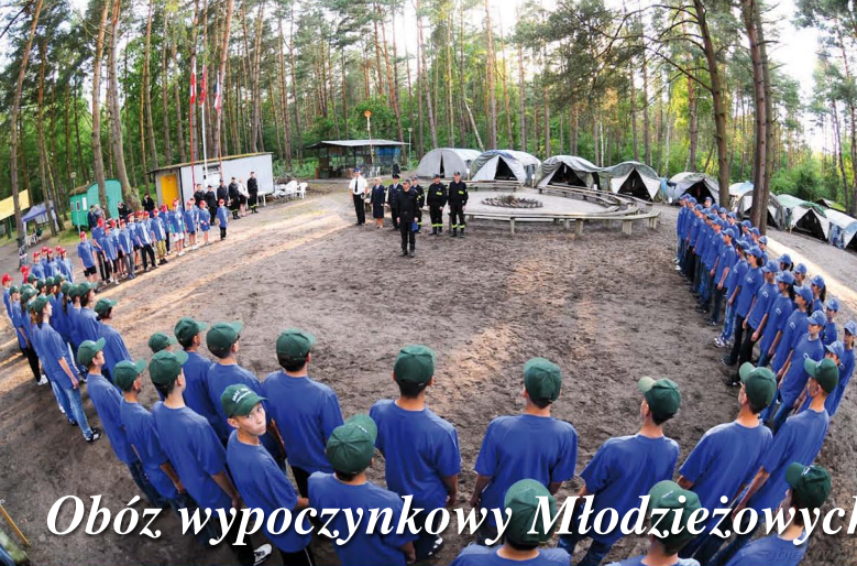
Obóz wypoczynkowy Młodzieżowych drużyn Pożarniczych w Jarostawcu