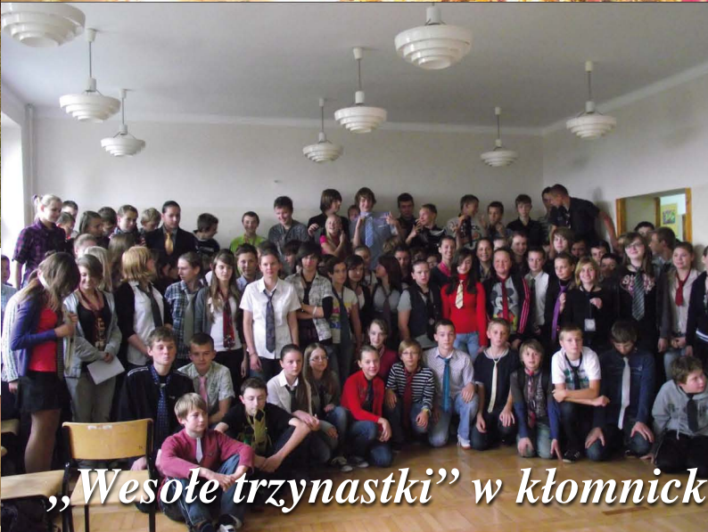
„Wesołe trzynastki” w kłomnickim gimnazjum